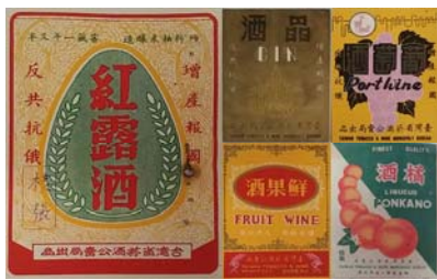
圖 5：臺灣菸酒股份有限公司高雄營業處， <產品標幟圖案改良設計>：0042/P443/1 <產品標幟包裝設計>：0045/P443/1 <圖案設計>：0046/P443/1

早期各行各業較不重視產品的包裝，工商業界之間的競爭也較少，普遍而言缺乏包裝設計的觀念，因此酒類產品亦僅以簡單形式處理，不過仍會在酒標設計上加註酒質原料及性能的說明 4 ，例如為加強消費者對紅露酒品質的認識，特地在酒標加印「純粹糯米釀造窖藏一年又半」的字樣 5 。隨著經濟發展，菸酒公賣局開始注意消費需求，如民國(以下同)46年擬變更橘酒酒標，即徵詢零售商及消費者之意見，最後以顏色較為鮮明、六顆橘子的樣張定案