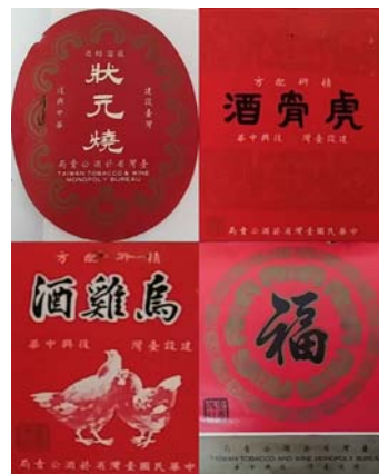
圖 4：臺灣菸酒股份有限公司高雄營業處，<產品包裝設計>：0057/P442/1. <產品包裝設計>：067/P442/1