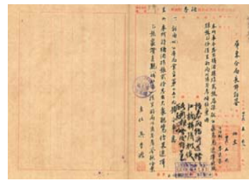
圖 6：臺灣菸酒股份有限公司高雄營業處， <圖案設計>：0046/P443/1

6 ，另外，菸酒公賣局經市場調查發現，紅露酒在鄉間銷路較特級清酒好，原因是民間喜慶宴會多購用紅色鮮豔標貼酒類，較為吉利 7 ，因而刊登報章獎賞徵求特級清酒精美標貼圖案，藉機宣傳清酒品質，刺激消費心理，以收增銷之效 8 。由此可見具特色的酒標，除可增強消費者印象，提升銷售量，還可以留存；透過端詳酒標的樣式與文字內容，更可進而瞭解這瓶酒的製造背景。