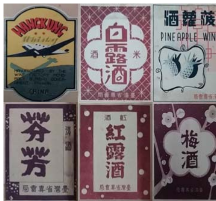
圖 3：臺灣菸酒股份有限公司高雄營業處，<產品標貼圖案改良設計>：0035/P443/1

貼都是管制品。早期臺灣菸酒公賣局為便於緝私時，容易識別真偽專賣品起見，特製各項菸酒商標式樣，轉飭查緝人員作為緝私時鑑別真偽之用 1 ，不只酒標背面印有密碼以防仿冒，每年也都會令發該年度酒類產品月份代字表一份，產品代字必須嚴格保密，以防範被偽製影射 2 。光復初期，酒標甚至作為政治宣傳紙用途，印有「增產報國、反共抗俄」等字樣，隨著政治情勢改變，六十年代改印「建設台灣、復興中華」，七十年代則印「三民主義、統一中國」，八十年代以後改用「酒後不開車、安全有保障」等公益警語，貼心提醒民眾在把酒言歡享用佳釀後，要留意酒駕的安全問題 3 ，由此亦可看出社會、文化以及政治環境的轉變。