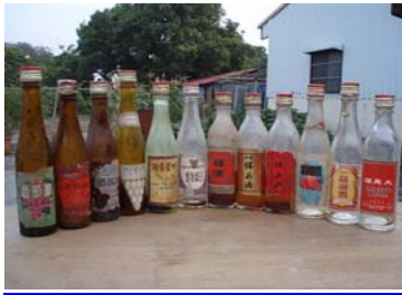
圖 1：台灣菸酒公賣局-早期酒類照片