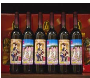
圖 7：

近來政府陸續開放國外菸酒進口，尤其 91 年 1 月 1 日起我國正式加入世界貿易組織(WTO)，廢止專賣制度，菸酒回歸稅制。面對菸酒產銷自由化之市場競爭，為提供優良產品，對於酒類產品的產製與包裝不斷推陳出新。為維護消費者權益，