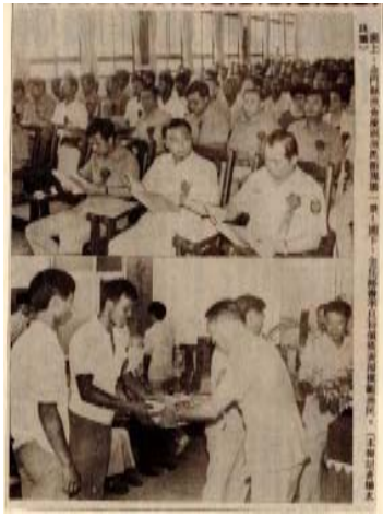
圖 2：77 年漁民節慶祝大會剪報，上圖為現場一景，下圖為表揚模範漁民：金門區漁會，〈77 年漁民節〉：0077/1101/001

除全國性的漁民節活動之外，各地漁會也會舉辦各自的慶祝活動，臺灣的外島「金門」，古語用「三山六海一分田」來描述其傳統經濟型態，大都依靠四面環海的條件，以海為田，經營傳統漁業。 9 在本局典藏金門區漁會的檔案中，可見以往辦理漁民節活動的紀錄。55 年，金門縣於金城大戲院舉辦第 6 屆漁民節慶祝活動，不僅頒發模範漁民獎品獎狀、於軍人服務社舉行餐會、免費招待觀賞 1 場電影，並於節日期間讓漁民免除民防義務 1 天。 10 其中模範漁民的選拔，可以從「58 年度金門縣漁民節模範漁民選拔辦法」中瞭解其選拔標準包括：一、思想純正篤行政令；二、對漁業增產有特殊表現者；三、刻苦耐勞節儉樸實者；四、敬愛軍人急公好義有顯著事蹟者；五、安份守己敦睦鄰里者。 11