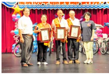
圖 3：103 年金門地區漁民節表揚漁民。

至 103 年則將漁業推廣活動與漁民節慶祝活動結合，並於同年 9 月 20 日舉辦「金門地區慶祝 103 年漁民節慶祝大會暨漁村產業文化推廣活動」，於金門縣社會福利館舉行，邀請地區數百位漁民以及眷屬共襄盛舉，會中由漁會家政班舞蹈表演、頒獎、摸彩等活動；除表揚模範漁民（模範事蹟有勤奮努力，熱心公益；進化家業，刻苦耐勞；熱心待人，服務熱忱；作業成績優異，漁獲買賣價格公道等）及優良小組長外，亦表揚資深漁民、模範漁家、優良家政班員等。館外廣場還舉辦地區漁村產業文化推廣活動，設有漁村社區卡拉 OK 友誼賽、漁村特色料理品嚐推廣、漁村的特產品 DIY、邀請金門農工職校指導水晶蠟燭、現撈金魚、活捉土虱體驗及海洋生物造型串珠 DIY 等活動。 13