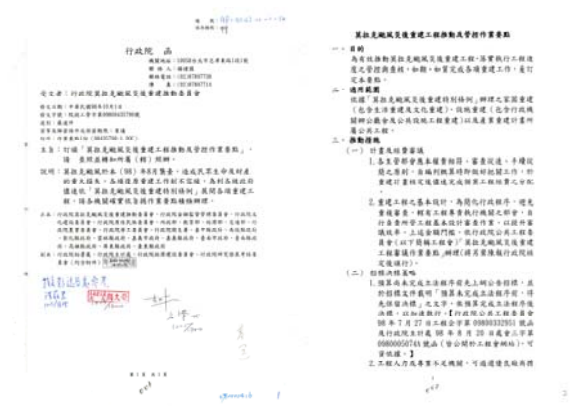
圖 2：莫拉克颱風災後重建工程推動及管控作業要點：行政院莫拉克颱風災後重建推動委員會，〈各組工作會報〉：0098/0103/1