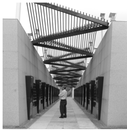
圖 4：小林村紀念公園。苦路兩側刻有 462 位逝者姓名，代表他們永留於此，供到訪者追思憑弔。