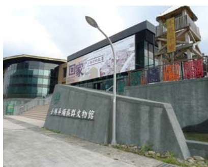
圖 3：小林平埔族文物館

風災後 5 年，各項重建工作已有具體成果，重建區的居民也在各界的關心支援下，擦乾眼淚，憑藉著堅韌的生命力，靠著自己的雙手努力，為家園帶來新生機。透過傳承與蛻變，如今的重建區不再是災區，而是國人美麗的後花園，真情巴士啟動了，人們看見了豐富又別具特色的原鄉產業及多元的旅遊環境，不論是尋訪鄒族聖山下最美麗的山豬部落來吉、到臺東嘉蘭村聆聽八個頭目家族尋根故事，還是體驗二處三地小林村的文化產業，來趟屬於你自己的重建小旅行吧，可以親自感受風雨過後彩虹重現的幸福。