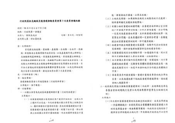
圖 1：第 3 次委員會議記錄：行政院莫拉克颱風災後重建推動委員會，〈各組工作會報〉：0098/0103/1

為加速重建效率，提供災民安全舒適生活家園，有效預防災害，莫拉克重建會首先通過「以國土保育為先的區域重建綱要計畫」（98 年 9 月 6 日第 3 次委員會） 2 作為災區重建政策的上位指導計畫，並陸續研擬「基礎建設重建方案」（98 年 11 月 25 日第 8 次委員會） 3 、「家園重建計畫（含生活及文化重建）」及「產業重建計畫」（98 年 12 月 30 日第 9 次委員會） 4 ，指引後續重建工作。另為有效推動災後重建工程，落實執行工程進度之管控與查核，行政院於 98 年 10 月 1 日頒布「莫拉克颱風災後重建工程推動及管控作業要點」 5 ，期能如期、如質完成各項重建工作。