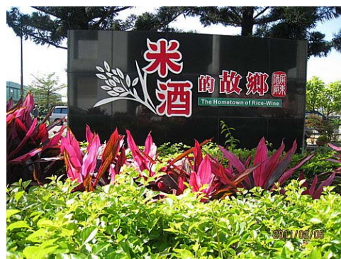
圖 2：屏東酒廠有「米酒的故鄉」之稱。

屏東酒廠以生產米酒見長，初創之時所使用的釀酒法稱為「在來法」，由於使用的釀造原料「白麴」含有許多雜菌，使得製作出來的米酒風味不一，失敗變酸的機率也相當高。直到 17 年，日本人神谷俊一將「阿米洛法」 3 成功運用於米酒製造，從此米酒有了一致規格化的風味。日據時期推出的米酒原先分為米酒第一、第二、第三號三種等級，後來將二號米酒改名為「赤標米酒」，也就是紅標米酒 4 。現今的臺灣菸酒公司所產的紅標米酒依酒精濃度、原料成分不同，可分