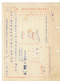
圖 5：米酒式瓶檢驗：臺灣菸酒股份有限公司屏東酒廠，〈酒類化驗〉：0073/452/1

由於米酒已與臺灣民眾飲食文化密不可分，導致其品質成分優劣自然成為消費者關心的議題，從屏東酒廠移轉檔案中可發現，曾有岡山鎮民眾向屏東酒廠抗議米酒含有大量酒精，妨害身體健康 8 ；更有民眾向聯合報投書，希望加強米酒酒瓶品質 9 ，為提升米酒品質及保障消費者權益，屏東酒廠定期召開品質管制會議，報告每月品管成績，也要求製瓶工廠提高米酒酒瓶品質 10 ，並委託行政院衛生署藥物食品檢驗局針對米酒中是否含有糖精、煤焦色素、甲醛等有害物質進行檢驗，酒瓶中是否含有銅、鉛等重金屬物質也在檢驗範圍，