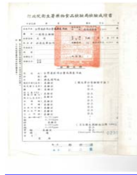
圖 3：檢驗成績書：臺灣菸酒股份有限公司屏東酒廠，〈酒類化驗〉：0073/452/1

臺灣自 88 年加入 WTO 後，正式施行「菸酒稅法」，依規定米酒將比照白蘭地、威士忌等蒸餾酒適用最高從量稅額，造成民眾瘋狂搶購，臺灣菸酒公賣局出貨不及，只好祭出每人限購兩瓶米酒的政策。又，於 102 年爆發「紅標米酒沒有米」的傳聞，造成消費者誤解及恐慌，使得臺灣菸酒公司急忙澄清「米酒不但是用米釀造，而且百分百用臺灣米」 12 ，儘管風波不斷，且酒類市場競爭日益激烈，然而臺灣民眾世代沿革的米酒食用習慣，使得紅標米酒在臺灣的「酒文化」中仍占有一席之地。