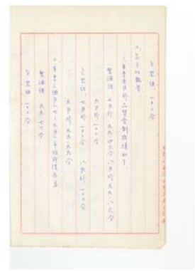
圖 4：品質管制會議紀錄：臺灣菸酒股份有限公司屏東酒廠，〈酒類〉：0070/452/1