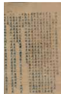
民間宗教團體的成立宗旨；臺灣省政府，〈中華民國文化宗教團體聯合會勘亂時期工作綱領〉：0038/0123.2/0013

民國 76 年解嚴後，我國對於宗教民俗的態度更改採自由方式，在不觸犯民、刑法或違反公序良俗等相關規定下，只要符合〈人民團體法〉的要求皆可成立，臺灣現今已成為宗教多元自由發展的國家。