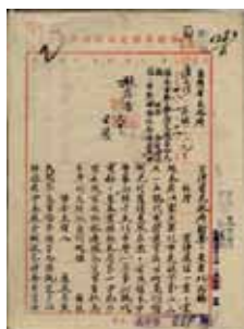
北市警局於臺北大橋查獲迷信活動； 臺灣省政府，〈查禁崇拜神權迷信〉： 038/0128.2/000

凡人在世，總得面對生死及未來的不確定感，這也就是宗教一直存在之原因。宗教之初衷本為撫慰人心與教人向善，然而部分不肖人士利用宗教名義來詐財騙色之情事卻時有所聞。例如去(100)年 11 月 28 日中央社報導擔任臺中市某科技大學社團指導老師的王姓男子，藉化解宗教的劫厄名義性侵社團 11 名女學生，王姓男子被控性侵現已遭收押。 1