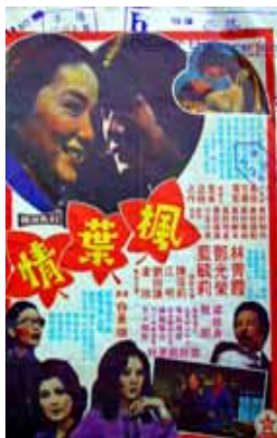
檔案影像來源：香港影庫 http://ppt.cc/txZL (2011/06/20 點閱)