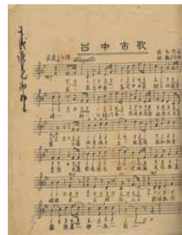
檔案影像來源：《本次市歌徵收卷》：37/385-11/1/1

臺中市之行政劃分在清代先後隸屬諸羅縣(1683)、彰化縣(1723)、臺灣縣(1887)，日治時期分屬臺中縣(1896)、臺中廳(1900)、臺中州(1920) 1 ；民國34年(1945)年臺灣光復後，臺中州改設為臺中縣、臺中市，其中臺中市為省轄市 2 ，直到民國99年(2010)12月25日，臺中縣與臺中市合併升格為直轄市 3 。回顧臺中市的發展歷史，可發現臺中市許多事物能代表其人文意涵與歷史軌跡，諸如市歌、市樹、市鳥、市花等 4 ；本季移轉之民國38年以前臺中市政府(以下簡稱中市府)的檔案即保留了中市府當初徵集市歌的過往紀錄。