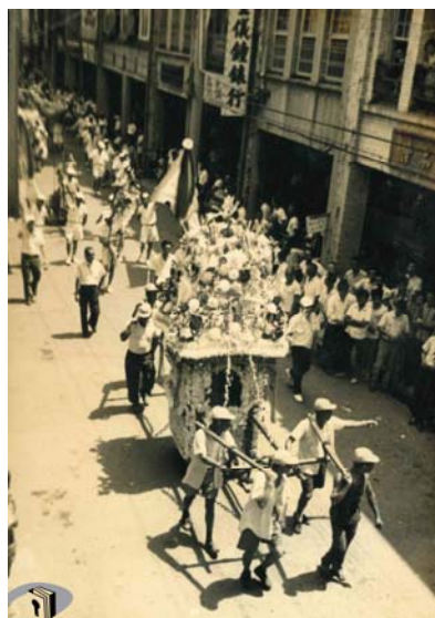
圖 4：民國 60 年迎城隍遶境實況