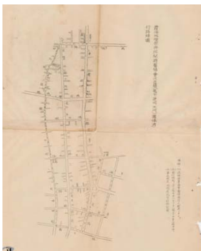
圖 3：霞海城隍廟五月十三迎城隍祭典遶境範圍涵蓋大同區傳統核心區域

臺北霞海城隍廟因大稻埕商業蓬勃發展，於清末、日本統治臺灣時期就已經享有盛名，香火鼎盛，從臺灣前輩藝術家郭雪湖於 1930 年榮獲臺灣美術展覽會第四回「臺賞獎」的《南街殷賑》來看，其以誇張、戲劇化筆法描繪大稻埕迪化街霞海城隍廟口節慶熱鬧景象 2 ，也說明了大稻埕街區的繁榮與霞海城隍廟信仰的發展，二者相互關係密切。除日常祭祀活動中有無數信眾前來上香祈福外，每逢城隍爺聖誕祭典期間(5 月 6 日至 18 日)，往來祝壽的信眾與香客更是熙來攘往，絡繹不絕(圖 1)。期間 5 月 11、12 日兩夜由城隍爺部屬八將等，巡視全境暗訪，13 日聖誕當日中午恭請城隍老爺出巡遶境 3 (圖 2)，遶境是依照該廟祭祀圈所形成的轄境區域進行巡視，跟著遶境走一遍，即可清楚當地的信仰脈絡(圖 3)。這時沿街信眾商家擺設香案祭拜祈求神明護佑平安並在此期間宴請賓客，而各種演藝團體亦接受商家之邀請，出陣遊行展演，並彼此爭奇鬥豔，當日擠滿全臺各地前來觀賞的信眾與觀光客，將熱鬧推送至最高潮。