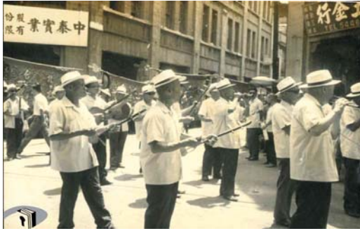
圖 5：民國 60 年迎城隍遶境實況