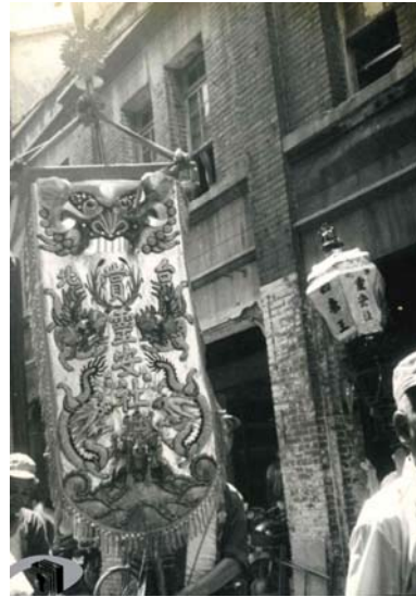
圖 6：臺北靈安社為迎城隍祭典中傳統藝術與民俗保存者

而這些軒社中有些始自清代以來，更陸續配合臺北霞海城隍廟的暗訪、遶境等活動而參與遊行，展現陣頭的實力，以增加熱鬧的陣容，舉凡裝扮神將、藝員演奏的北管、北管子弟戲的演出等，都展現其成員歷經長久訓練與默契配合的精湛技藝，呈顯民間技藝難能可貴的文化傳承 4 。例如臺北靈安社(圖 6)於 100 年被臺北市政府依文化資產保存法登錄為民俗「臺北靈安社神將陣頭」保存者、101 年多尊神將及神像被指定為一般古物後，又於 112 年登錄為傳統藝術「北管」保存者 5 ，深獲無形文化資產保存與推廣之肯定。五月十三迎城隍是大稻埕重要信仰活動，也是北臺灣一大宗教盛事，祭典自清末至今已有百