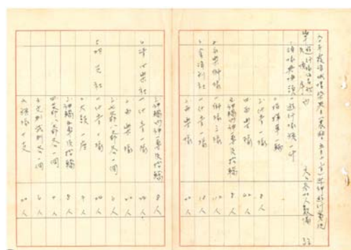
圖 2：民國 60 年霞海城隍祭典日(農曆五月十三日)各藝陣遊行順序