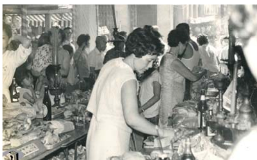
圖 1：霞海城隍廟祭典的參拜人潮

臺北霞海城隍廟主祀城隍爺，原為福建泉州府同安縣居民的原鄉守護神，後成為來臺同安人之共同信仰，見證了臺北平原移民拓墾史。大稻埕的建街係從艋舺同安人移居後才開始，霞海城隍廟在大稻埕建街之初建廟(1856 年)，成為該地區的主要信仰中心，後來大稻埕逐漸取代艋舺成為臺北的經濟發展中心 1 ，商人利用廟會促銷商品，將迎神賽會與商業經濟聯結起來，使得霞海城隍爺的神威遠播，全臺盡知。