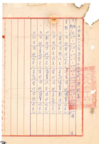
圖 2：農忙托兒所課程表

習慣(圖 3)。老師和保母還會將美援會送來的麵粉，按量調製麵包、餅乾，或烹煮牛奶供學童食用，除了更能吸引兒童到托兒所，按時上下課也對兒童發育有良好的幫助。