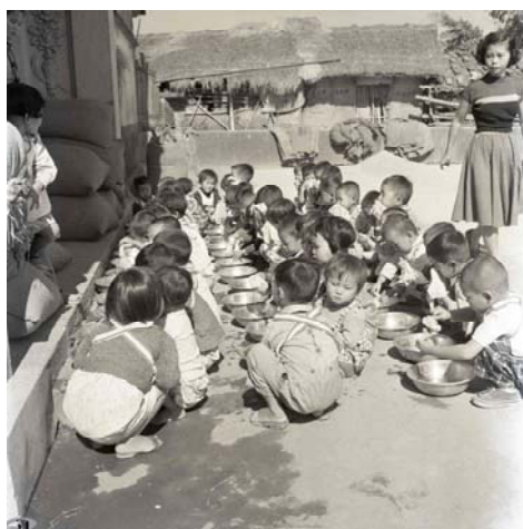
圖 3：農忙托兒所學童們的盥洗情形