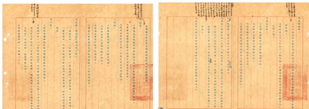
圖1：農忙托兒所計畫草案

二戰後臺灣的社會發展以農業為主，婦女在農忙時節通常要協助農務工作，因而無暇照顧家中兒童。民國(以下同)44年，政府為了讓農村兒童能獲得更好的托育照顧，減輕農村婦女的負擔，並讓家長們無後顧之憂的安心工作，便開始在各鄉鎮成立「農忙托兒所」，農忙托兒所最早屬於季節性的短期托育，每班聘請教師和保姆各一名，每班以30人至40人為原則，招收對象為轄區內農家兒童年滿3足歲至6足歲且身無疾病者，皆可申請送所托育，上課內容以培養學齡兒童的知識為目的，並按期辦理衛生檢查注射保健工作，並以兒童日常生活為中心來施行單元教材(圖1)。