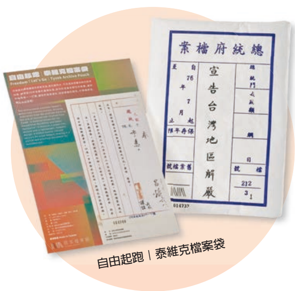
自由起跑 | 泰維克檔案袋

配合全新開幕之常設展及特展，另推出 3 款檔案內容文創新品「自由起跑 | 泰維克檔案袋」、「特急密封箱膠帶」、「轉動禁歌卡帶鉛筆組」，自常設展與特展選件內涵中，汲取檔案特色意象進行轉化：檔案袋設計選用抗撕防水、可洗滌與摺疊收納的耐用材質，呼應「重返 1987—解嚴檔案」特展選件——紙解嚴令，象徵歷經 38 年戒嚴的臺灣社會，如今形成最有韌性的集體；封箱膠帶靈感源自外交部一紙特級密公文，如今解密的檔案走向公開透明，更顯貼近你我生活；再平凡不過的六角鉛筆，筆桿印上禁歌年代發行禁制緣由，除了用來寫字，還可以用來體驗「轉卡帶」的樂趣。透過文創品開發，讓國家記憶與檔案故事走入民眾生活日常，更顯國家檔案多元內涵的價值與底蘊。