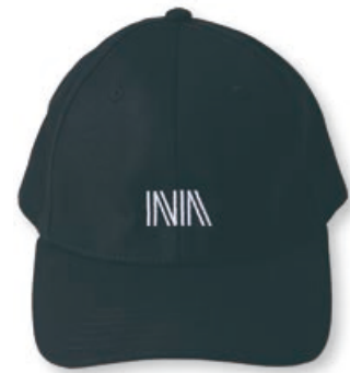
國家檔案館文脈棒球帽