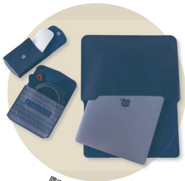
國家檔案館形象筆電立架包