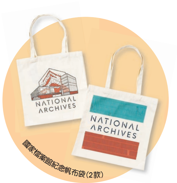
國家檔案館紀念帆布袋(2款)