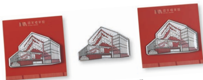
國家檔案館建築造型磁鐵