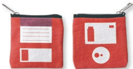
懷舊 3.5 磁碟零錢包