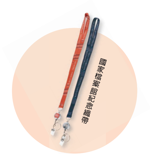
國家檔案館紀念織帶