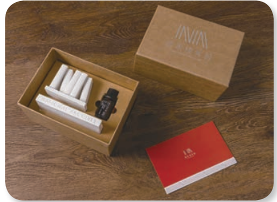
國家檔案館紀念擴香石