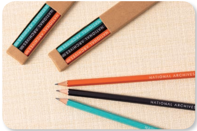
國家檔案館記錄生活鉛筆