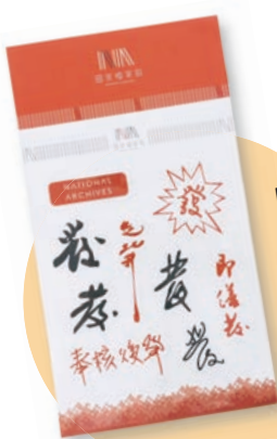
國家檔案館紀念貼紙