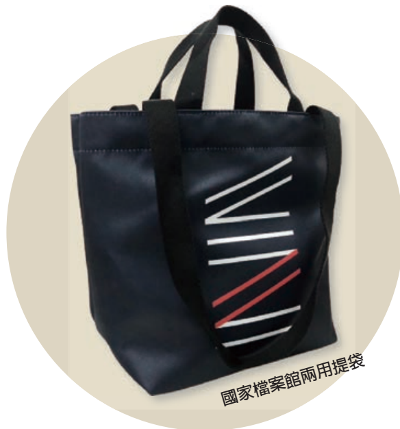
國家檔案館兩用提袋