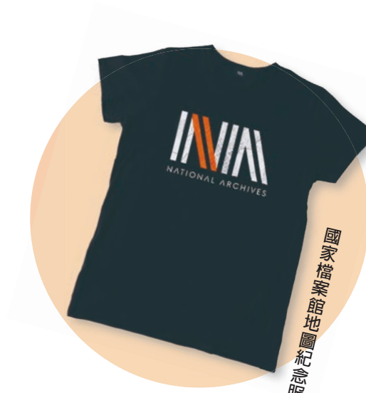
國家檔案館地圖紀念衫