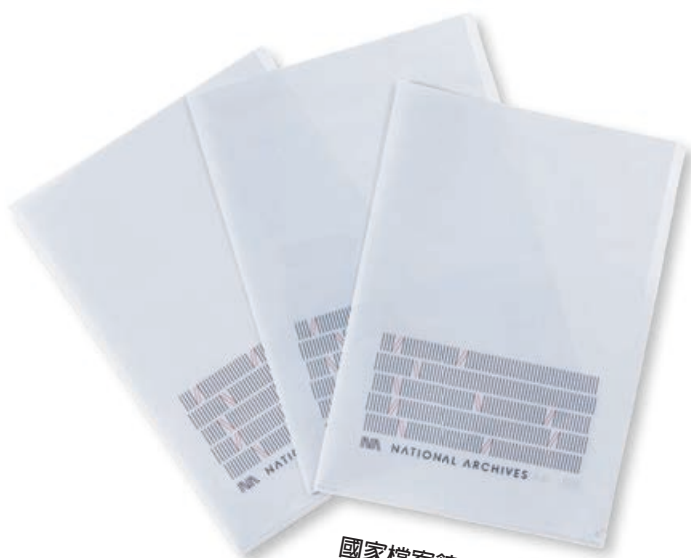
國家檔案館收納文件夾