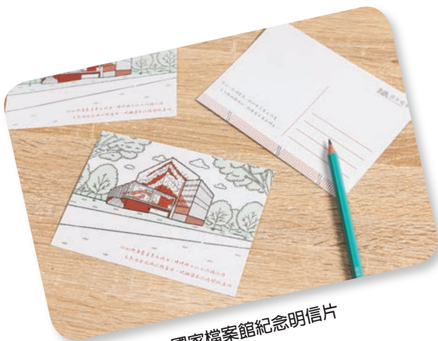
國家檔案館紀念明信片