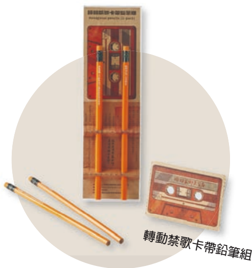
轉動禁歌卡帶鉛筆組