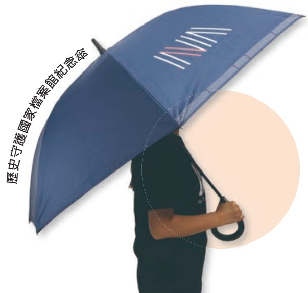
歷史守護國家檔案館紀念傘