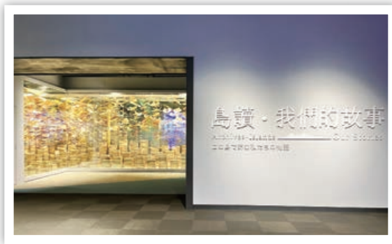
❑ 「島讀：我們的故事」常設展入口意象

千百年來，有人冒死來臺，有人黯然離開，有人落地生根，也有人如過客。不論先來後到，不論離開或留下，他們都寫下了自己與臺灣相遇的故事。國家檔案館常設展以「島讀·我們的故事」為主題，依時間為軸，分成「和平何時靠岸：一九四五年後的變局」、「來自太平洋彼端的神秘力量：隨冷戰而來的美援」、「在強權的夾縫裡壯大：大建設的時代」、「街頭的聲音震開了廟堂：民主化浪潮」及「在世界的浪潮裡，定位自己：多彩臺灣」等 5 大單元、11 項主題，以及互動單元「與檔案交會的生命經驗」，娓娓述說來自檔案的故事。