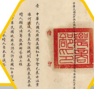
全國水利局總裁張書與美國 駐華公使芮恩施簽訂之募集 導准借款草議(個人捐贈)