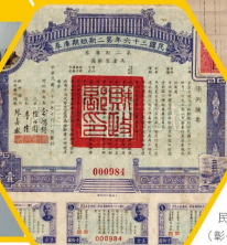
民國36年第2期短期庫券 (彰化縣農會捐贈)