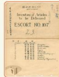
圖6-1 檔號：0035/771.4/6010.3 案名：日艦接收清冊 來源機關：國防部史政編譯局 管有機關：國家發展委員會檔案管理局