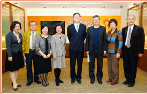
國家發展委員會副主任委員紫軍(右4)、黃副主任委員萬翔(右3)與本局陳局長旭琳(左4)等人於國家檔案瑰寶區合影