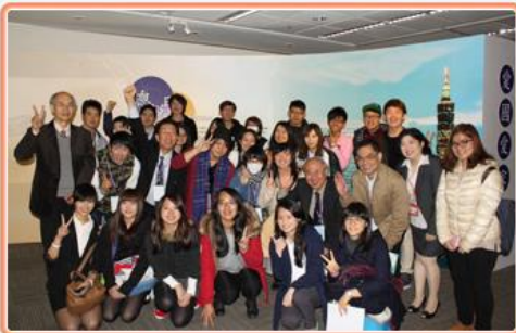
日本鶴見大學圖書、檔案及資訊研究學系暨世新大學資訊傳播學系師生與本局同仁合影

國家發展委員會副主任委員紫軍偕同黃副主任委員萬翔、曾主任秘書雪如與何參事志忠等人，於104.02.25蒞局聽取業務簡報，並巡視本局國家檔案庫房及展覽廳。