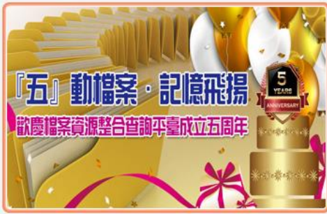
「五」動檔案·記憶飛揚 ACROSS五周年有獎活動