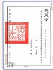
圖6 檔號：0086/513/1 案名：各種會議紀錄、速紀錄等 來源機關：國民大會 管有機關：國家發展委員會檔案管理局