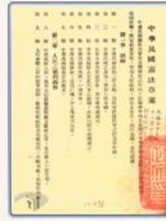
圖4 檔號：0035/513/1 案名：各種會議紀錄、速紀錄等 來源機關：國民大會 管有機關：國家發展委員會檔案管理局