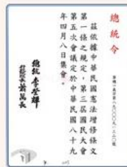
圖7 檔號：0089/322/1/ 案名：準備會報、召集令 來源機關：國民大會 管有機關：國家發展委員會檔案管理局