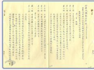
圖3 檔號：0013/011.1/5000 案名：中華民國憲法 來源機關：國防部史政編譯局 管有機關：國家發展委員會檔案管理局

17年6月，蔣中正領導國民革命軍北伐告成，統一全國。20年，國民政府公布《訓政時期約法》，進入訓政時期，極力催生憲法以進入憲政時期。25年5月，政府頒布《五五憲草》(圖3)，融入孫中山先生五權分立的理想，實為《中華民國憲法》的雛形。26年7月，對日抗戰爆發後，制憲工作被迫停擺。迨抗戰勝利，中國國民黨、中國共產黨、中國青年黨、中國民主同盟及社會賢達代表於35年1月「政治協商會議」，通過《政協憲草》。11月15日，制憲國民大會通過《中華民國憲法草案》(圖4)，確立五權分立的架構，也融合內閣制之民主憲政精神，並於36年12月25日正式施行(註3)。