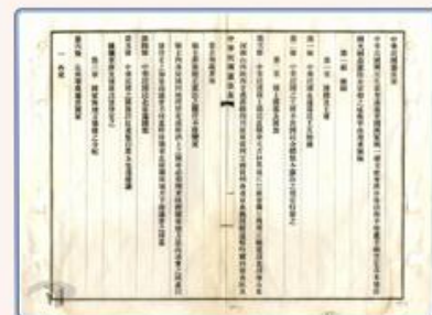
圖2: 民國14年制定之「中華民國憲法案」條文(部分),史稱「段祺瑞憲法」。