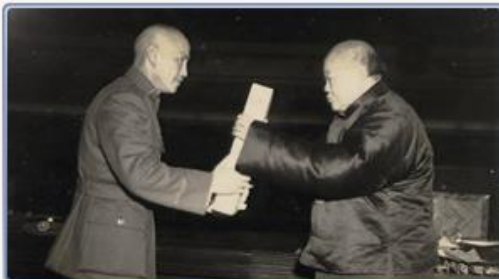
制憲國民大會主席吳稚暉將《中華民國憲法》交給國民政府主席蔣中正