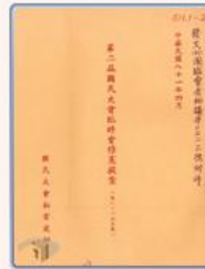
圖5 檔號：0081/511/1 案名：代表(一般、修憲)提案 來源機關：國民大會 管有機關：國家發展委員會檔案管理局