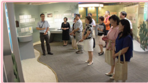
「中華民國南疆史料特展」本局展覽廳展出現況

海人草乃生長於海邊的一種藻類，具有抑制寄生蟲的療效。清光緒年間，日本商人發現我國東沙島蘊藏海人草，立刻前往開發，掀起兩國主權交涉之爭。配合103年9月1日起在本局展覽廳、國史館及國立國父紀念館等地同步展出的「中華民國南疆史料特展」，本文特別從國家檔案(註1)中有關海人草的開發來探索我國東沙島主權的維護。