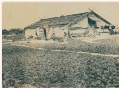
圖3：日人曬海花之狀並貨倉一間 檔號：0012/944/5090 案名：東西沙群島開發案 來源機關：國防部史政編譯局 管有機關：國家發展委員會檔案管理局