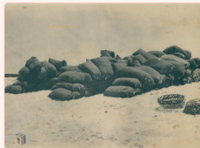
圖4：網包待運情形 檔號：0012/944/5090 案名：東西沙群島開發案 來源機關：國防部史政編譯局 管有機關：國家發展委員會檔案管理局