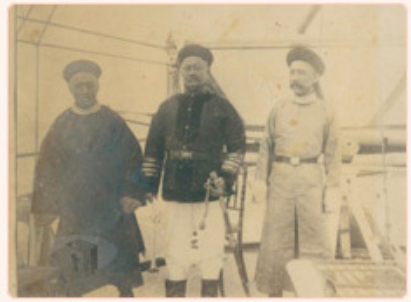
圖1：前清粵省特派接收東沙島之官員 檔號：0012/944/5090 案名：東西沙群島開發案 來源機關：國防部史政編譯局 管有機關：國家發展委員會檔案管理局

民國(以下同)12年，香港總商會透過英國駐華使館，聯繫北京政府，表示願意撥款協助東沙島設立無線電氣象觀測臺。北京政府考量後，決定設置，並由海軍部等籌劃(圖2)。隔年，海軍部派員搭乘英國艦隊前往東沙島勘查，驚見日本漁民在島上曬製海人草，甚至網裝海人草準備輸出(圖3、圖4)。外交部得知消息後，立刻請日本政府嚴令禁止屬民非法活動(圖5)。14年，海軍部人員再次登上東沙島，驅趕日本漁民離開後，立即建置觀測臺(註4)。