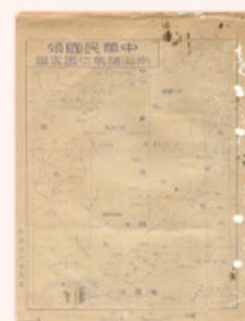
圖10：中華民國領南海諸島位置略圖 檔號：0035/061.8/3030 案名：進駐西南南沙群島案 來源機關：國防部史政編譯局 管有機關：國家發展委員會檔案管理局

為了鞏固我國在南海的主權，以及讓民眾瞭解政府經營東沙島、太平島之作為，內政部特與國史館、中央研究院、外交部、國防部、行政院海岸巡防署、國家發展委員會檔案管理局、國立國父紀念館、文化部文化資產局及高雄市政府等機關聯合舉辦「中華民國南疆史料特展」，展覽內容包含「南海諸島歷史淵源」、「南海諸島設治」、「南海諸島主權之維護」、「南海諸島經營與管理」及「相關人物事蹟」等主題。北部展次自本(103)年9月1日至10月31日，分別在本局展覽廳、國史館及國立國父紀念館展出，南部展次自10月10日至11月10日在高雄大東文化藝術中心展出，以及中部展次自11月17日至12月31日在臺中文化創意產業園區展出(圖11)。歡迎民眾前來參觀，一同關注我國的南海主權。