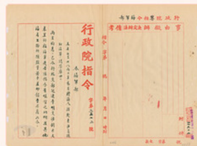
圖6： 檔號：0025/002.4/5090 案名：東沙島資源調查與管理案 來源機關：國防部史政編譯局 管有機關：國家發展委員會檔案管理局

24年，廣東省為加強管理東沙島，設立了東沙管理處，並加派海軍前往周邊海域巡守，以防堵日本恣意開採資源之舉。25年，日本無視廣東省的行為，大舉開採東沙島上的海人草，我國行政院以此危害國家領土主權，立刻令外交部與之交涉(圖6)。是時，日本侵華野心熾盛，已無視外交部的主張，甚至派遣艦隊巡航南海，開槍擊射我國漁船，情勢緊張(圖7)。其間，我國政府鑑於日本積極攫取海洋資源，方開始調查海人草的功用，進而掌握驅蟲的藥效(圖8、圖9)。正當我國準備開發海人草之際，日本卻發動盧溝橋事變，使得整個開發計畫被迫中斷。之後，日本加速占領東沙島與南海諸島，至28年，將這些島嶼劃歸高雄州管轄。