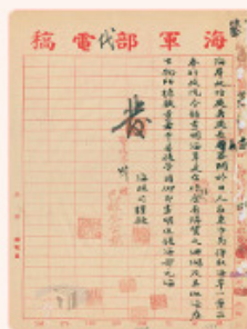
圖8： 檔號：0025/002.4/5090 案名：東沙島資源調查與管理案 來源機關：國防部史政編譯局 管有機關：國家發展委員會檔案管理局