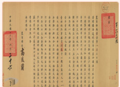
圖5： 檔號：0012/944/5090 案名：東西沙群島開發案 來源機關：國防部史政編譯局 管有機關：國家發展委員會檔案管理局

海人草製成的驅蟲藥方，除了臺灣，在日本、香港、德國也非常暢銷，讓許多商人趨之若鶩。16年1月，廣東志昌行向海軍部申請了東沙島海人草5年的開發案，卻私下與日商共同經營，牟取暴利。廣東省得知消息，請海軍部撤銷志昌行的執照，明令日方人士撤離東沙島，以維繫我國主權(註5)。