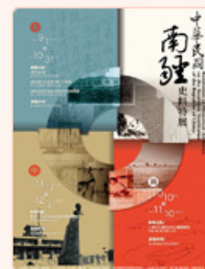
圖11：中華民國南疆史料特展海報