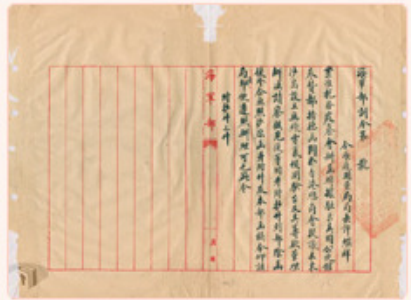
圖2： 檔號：0012/944/5090 案名：東西沙群島開發案