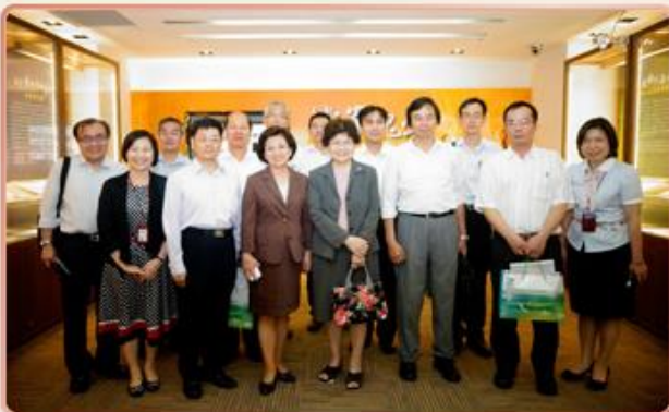
第7屆國家檔案管理委員會委員於國家檔案瑰寶區合影