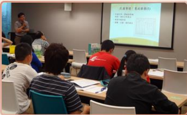
國立東華大學歷史學系師生參訪本局

第7屆國家檔案管理委員會第1次會議於103.05.14召開，由陳主任委員旭琳主持，會中除提出本局「102年國家檔案徵集移轉成果及未來工作重點」、「案藏瑰寶－國家檔案菁華展辦理情形」及「電子文書檔案服務中心啟用情形」等報告外，另討論委員提案「請成立國家檔案館」之議題。當日會後，並邀請委員參觀本局國家檔案保存維護中心及國家檔案閱覽暨展示中心等設施及展覽。