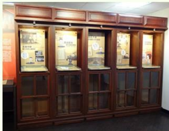
國立臺灣大學在「在檔案中看見歷史」展覽中，利用舊書櫃作為展櫃。

透過本機關或合辦機關適宜的空間，現有的櫥櫃、電腦、電視等作為展覽場地及展出設備支援，可節省展覽經費支出。