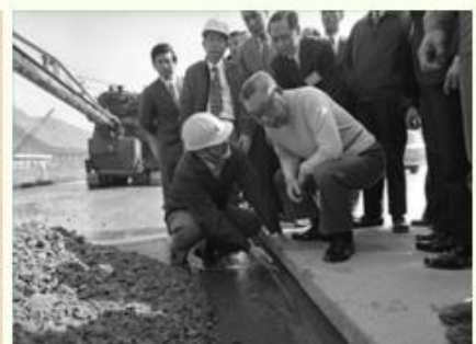
「世紀交通—運輸重要檔案展」展出之檔案：北迴鐵路興建工程畫冊(左)、63年行政院院長蔣經國視察南北高速公路(右)。