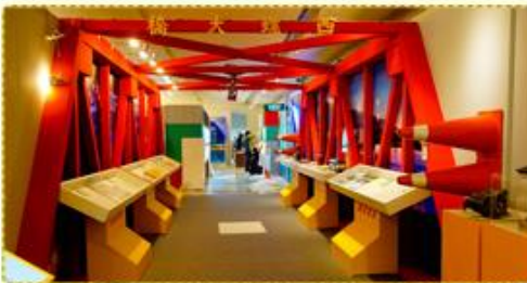
「世紀交通-運輸重要檔案展」臺北展場

在檔案應用意識逐步提升的今日，許多機關想要透過辦理檔案展覽推廣檔案加值應用，但往往因為缺乏展覽經驗或經費，不知如何著手。以下將以產品(Product)、人(People)、價格(Price)、地點(Place)及行銷(Promotion)等5P，與您分享辦理檔案展覽之經驗。