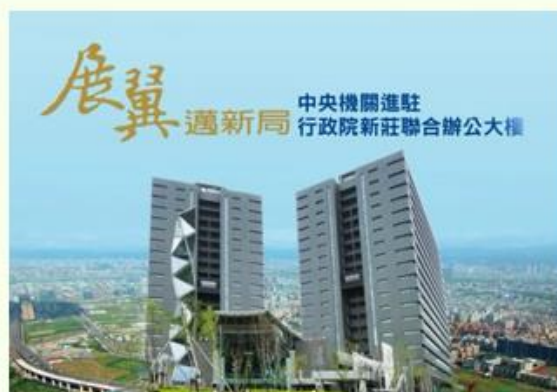
「展翼飛鴻—新莊副都心機關進駐歷程檔案特展」公益廣告託播影片畫面。

另，不要忘記了，機關如自有其他適宜免費行銷管道，或屬地區性的行銷管道，亦可充分利用，以增加宣傳效益。