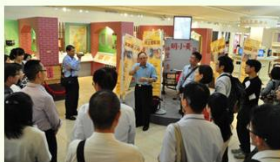
導覽人員於展覽現場之導覽解說。