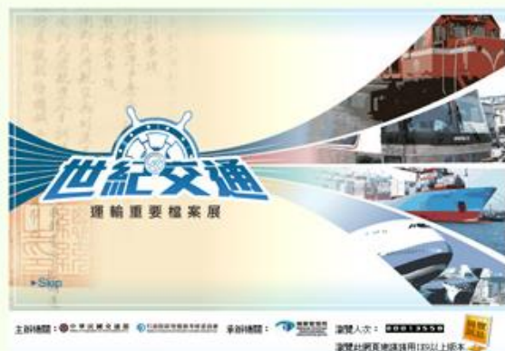
「世紀交通—運輸重要檔案展」線上展覽系統網頁。

為便利觀展者參觀，展覽地點的擇選宜以多種大眾運輸系統或較多人潮聚集之處，較能發揮效益，如選擇於機關內部辦理展示，應特別考量民眾可自由進出或易於觀展之地點與區位；另外，在網路發達的今日，機關亦可於虛擬的網路空間，同步建構線上展覽系統，提供民眾隨時隨地上網瀏覽的服務。