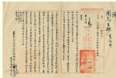
圖5 檔號：0036/120/004/001/009 案由：遵令將鑑定接管毛公鼎情形呈復由 來源機關：國立故宮博物院 管有機關：國家發展委員會檔案管理局

隨後，國共戰爭全面爆發，籌備處再次準備遷徙作業，從院藏文物選擇精品，陸續遷運至臺灣，計有852箱文物（圖6）。籌備處為了存放這些遷臺文物，暫向臺灣糖業公司臺中糖廠借用倉庫（圖7）。