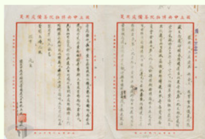
圖6 檔號：0038/500/001/001/003 案由：函為遵屬將院藏文物選擇精品陸續運台茲將三次運台箱件及存京箱件各製清單附上等由 來源機關：國立故宮博物院 管有機關：國家發展委員會檔案管理局