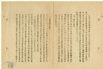
圖2 檔號：0023/400/005/001/002 案由：函知召開第一次建築委員會情形 來源機關：國立故宮博物院 管有機關：國家發展委員會檔案管理局

26年七七事變爆發後，籌備處奉命西遷，翌年向四川重慶大學借地，與中央研究院合建臨時庫房，將分批遷運的文物暫存於此（圖3）。未久，日軍戰機轟炸重慶，籌備處在28年遷往雲南昆明，鑑於情勢緊急，甚至把兩具漢代畫像石棺埋藏於川東聯立師範學校，委請該校照料（圖4）。29年籌備處因應時局變化，再隨同中研院史語所等機關遷往四川南溪李莊。