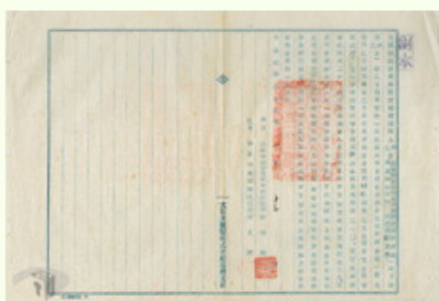
圖7 檔號：0038/500/001/001/012 案由：為代建房舍業已完工檢附費用明細表及退還餘款支票一紙電請查收見復由 來源機關：國立故宮博物院 管有機關：國家發展委員會檔案管理局