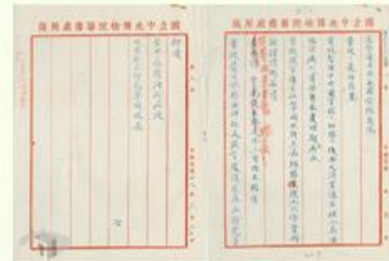
圖4 檔號：0028/500/001/001/006 案由：函為請將深埋漢畫像石棺辦理情形存卷備查並請賜復 來源機關：國立故宮博物院 管有機關：國家發展委員會檔案管理局