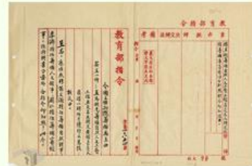
圖1 檔號：0022/400/001/001/004 案由：據呈擬籌備自然人文工藝三館茲定名及聘定各館籌備專員應准分別照聘令仰知照由 來源機關：國立故宮博物院 管有機關：國家發展委員會檔案管理局

民國建立後，隨著新式教育的推行與社會風氣的開收，教育部為了展示歷史文物並推廣社會教育，爰於民國（以下同）22年在南京成立國立中央博物院籌備處（以下簡稱籌備處）（註1），任命中央研究院歷史語言研究所（以下簡稱中研院史語所）所長傅斯年為籌備處主任，並且聘請翁文灝、李濟、周仁分別擔任該院自然館、人文館與工藝館籌備專員，開始規劃各項工作（圖1）。