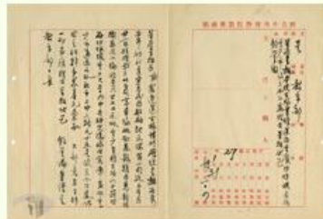
圖3 檔號：0027/500/001/001/014 案由：呈報本院古物業經運存重慶並在重慶市設立辦公處理台呈報伏乞鈞鑒由 來源機關：國立故宮博物院 管有機關：國家發展委員會檔案管理局