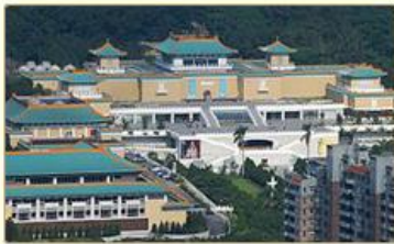
位於臺北外雙溪國立故宮博物院

國立故宮博物院的「毛公鼎」，聞名遐邇，但很多人不知道的是它來自南京中央博物院籌備處。當年，中央博物院籌備處的珍貴文物，歷經對日抗戰與國共戰爭而多次搬遷，至民國38年末臺，與故宮文物暫存放於臺中霧峰，之後，故宮博物院於臺北外雙溪興建新館，兩院文物合併收藏，「毛公鼎」成為故宮博物院的人氣國寶之一。現在就讓國家檔案帶大家一探中央博物院籌備處的過往故事！