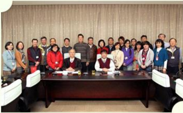
總統府第二局陳局長煇堅(前排坐者,右)、本局張副局長聰明(前排坐者,左)與參與人員合影