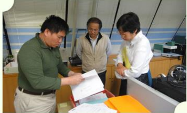
本局輔導訪視小組成員實地瞭解機關檔案管理作業狀況

本局分別於103.02.20、02.24及03.07前往總統府、考試院及國軍退除役官兵輔導委員會辦理機關檔案管理輔導訪視實地複訪作業。