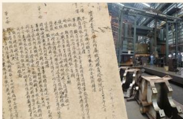
臺灣機械(股)公司檔案

國立臺灣大學圖書資訊學系學生於102.11.29蒞局參訪，同學除瞭解國家檔案典藏內容、檔案檢索及申請應用流程之外，亦參觀國家檔案庫房與國家檔案及圖書閱覽中心！參訪過程，同學互動踴躍，趣味橫生。歡迎有興趣瞭解國家檔案的機關團體蒞局參觀，相關參訪資訊請洽本局(02)8995-3614翁小姐。