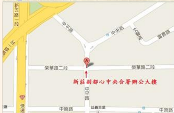
新北市新莊區中平路439號北棟1樓