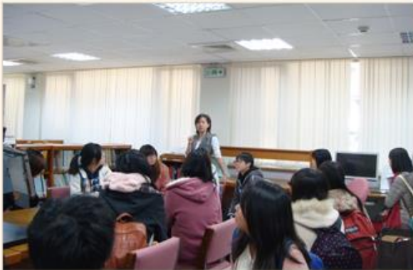
臺灣大學圖書資訊學系學生參訪本局

本局舉辦之「檔案資源查詢不NG-填問卷抽好康」活動，業於102.11.20結束，感謝各界熱情參與，並提供相關建議。本活動已業102.11.22公開抽獎，計有73人得獎，恭喜得獎人。 查詢得獎名單