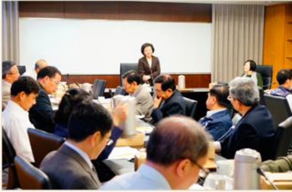
第6屆國家檔案管理委員會第2次會議開會情形