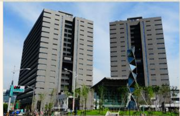
新莊副都心中央合署辦公大樓