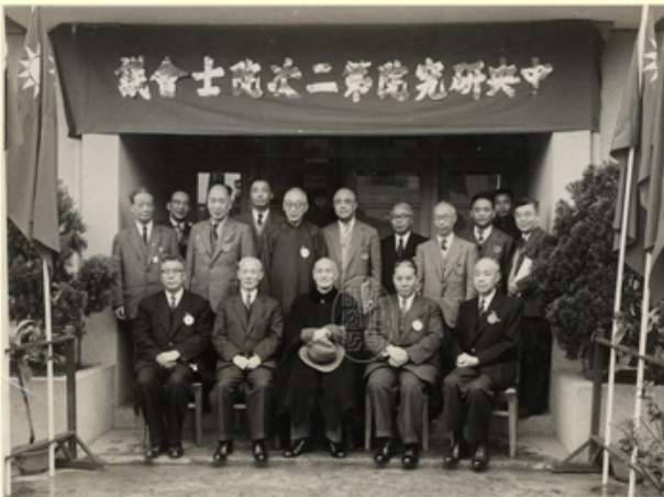
圖11 第二次院士會議團體照