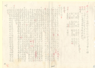
圖5 檔號：0039/0125/01 案名：院務會議 來源機關：中央研究院 管有機關：檔案管理局

史語所遷臺後，租賃楊梅火車站的倉庫與附近幾間民房，暫時放置從中國大陸運來的兩千多箱珍貴圖書文物，所內人員居住環境不佳(註3)，時任中研院總幹事的周鴻經表示：「楊梅同仁居住太苦，自應設法改善現租之房屋。」(圖6)