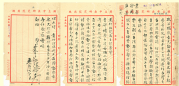
圖7 檔號：0037/000608/1 案名：總裁謝函 來源機關：中央銀行 管有機關：檔案管理局

朱家驊最後選擇以臺北近郊的南港作為基地，逐步重建中研院。43年12月舉行的當年度第二次院士談話會(圖8、9)，在中研院的發展歷程具有相當重要性，其重要決議包括：