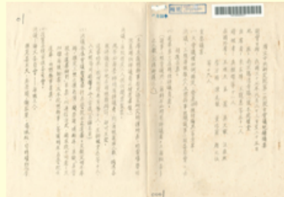
圖3 檔號：0037/0113/01 案名：院士會議--正式會議 來源機關：中央研究院 管有機關：檔案管理局