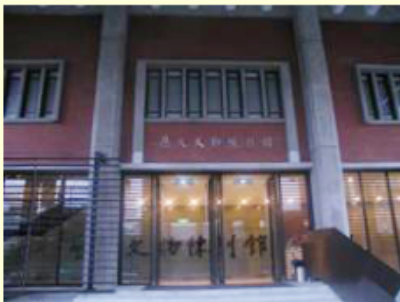
中央研究院歷史語言研究所歷史文物陳列館