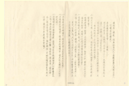
圖4 檔號：0037/0113/01 案名：院士會議--正式會議 來源機關：中央研究院 管有機關：檔案管理局

隨著國共內戰擴大，為延續學術的火種，朱家驊開始籌備中研院的搬遷工作，但基於學術自治原則，由各研究所自行決定是否遷移。中研院從南京經上海，南下廣州，再轉向重慶，歷經艱辛，增添搬遷工作的難度(圖5)，最後僅有總辦事處與歷史語言研究所(以下簡稱史語所)、數學研究所遷至臺灣。院士則有9位來臺，12位到美國，其餘均留在中國大陸(註2)。