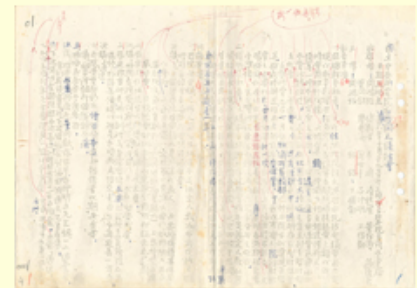
圖6 檔號：0038/0125/01 案名：院務會議 來源機關：中央研究院 管有機關：檔案管理局

朱家驊因中研院經費枯竭，所以按臺灣省政府(以下簡稱省府)之相關規定，函請中央銀行擔保經省府核定之墊付款項，爭取中研院在臺人員自38年2月起比照臺灣大學教職員待遇，以解決生活困難之窘境(圖7)。