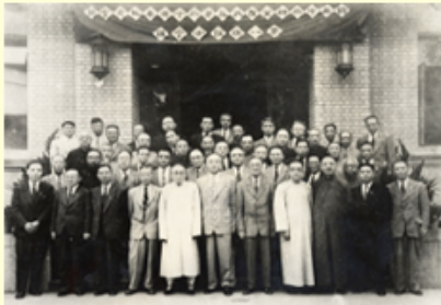
圖2 第一次院士會議團體照