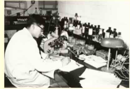
圖10 植物研究所研究人員操作實驗儀器