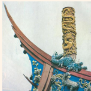
圖7 通天柱（孔廟屋脊上特有的筒狀物，又稱經塔、藏經筒）

祭孔典禮究竟使用八佾舞還是六佾舞，向來各有主張。一派主張孔子過世後，雖被封為文宣王，有諸侯地位，但採天子專用八佾舞祭之，於禮法不合，應用六佾舞為宜；另一派主張孔子德高望重，對後世影響深遠，歷史地位更勝帝王，故用八佾舞並無不可，反更顯祀典慎重。雖然「祭孔禮樂工作委員會」曾對釋奠儀式進行研究，但佾舞之使用仍然沒有定論，最後則視孔廟丹墀大小來決定佾舞使用規格。臺北孔廟因丹墀面積較小，遂採用六佾舞(圖6)，但近年已將丹墀擴修加大，已開始展演八佾舞，臺北孔廟的佾生多由臺北市大龍國小同學擔任。