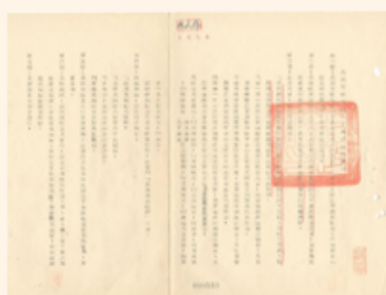
圖4 檔號：0037/2215311/4 案名：孔子誕辰紀念 來源機關：總統府 管有機關：檔案管理局