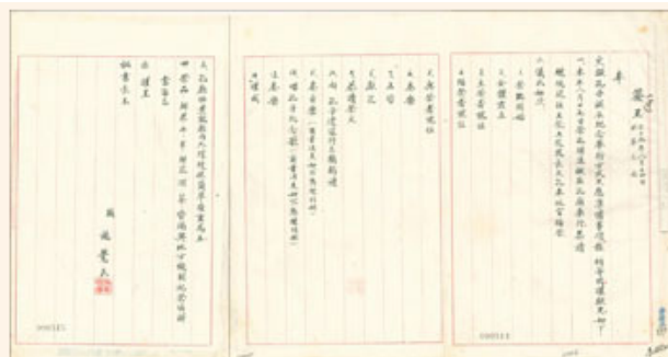
圖2 檔號：0037/2215311/4 案名：孔子誕辰紀念 來源機關：總統府 管有機關：檔案管理局

自民國以來，各省縣祭孔典禮雖多沿清制，然因祭祀方式與內容並未齊一(圖2)。57年，蔣中正總統指示教育部、內政部整理研究祭孔禮樂衣冠，旋經邀集專家學者組成「祭孔禮樂工作委員會」，就禮儀、服裝、樂舞、祭器等方面，參採古籍並斟酌時宜，研究新的改良方案，並數次在臺北孔廟實地演練。57年，行政院通過「大成至聖先師孔子誕辰紀念辦法」，規定各級政府應於9月28日舉行孔子誕辰紀念大會，並由當地政府最高行政首長主持(註4)(圖3~4)。