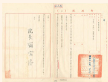
圖3 檔號：0037/2215311/4 案名：孔子誕辰紀念 來源機關：總統府 管有機關：檔案管理局

「祭孔禮樂工作委員會」於59年完成「祭孔禮樂之改進」方案，釋奠所用「咸和」、「寧和」、「安和」、「景和」四樂章乃採明朝古禮，佾舞亦根據明譜研修而成，佾生等人服裝則參酌古制改良，獻官則由現任政府官員擔任，並著藍袍黑褂行禮(註5)(圖5)。