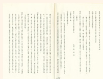
圖5 檔號：0059/0402/001 案名：文藝研究與推行

釋奠典禮儀節分「預備、迎神」、「祭祀」、「送神、禮成」三大部分，由通贊唱釋奠典禮開始，接著「鼓初嚴」遍燃庭燎香燭，至「撤班」時獻官、祭官、佾生等人依次退場，直到禮成為止，共有37項步驟(註6)。