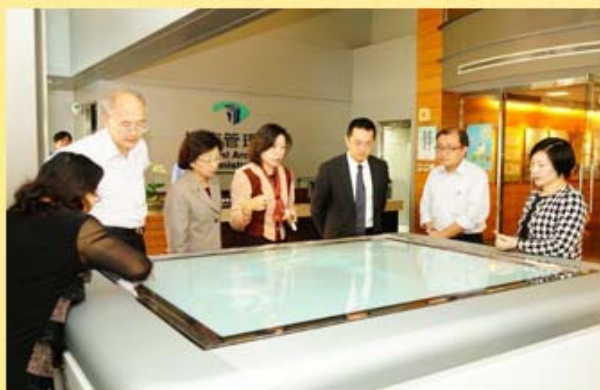
行政院研究發展考核委員會范姜副主任委員泰基(右3)蒞局視察