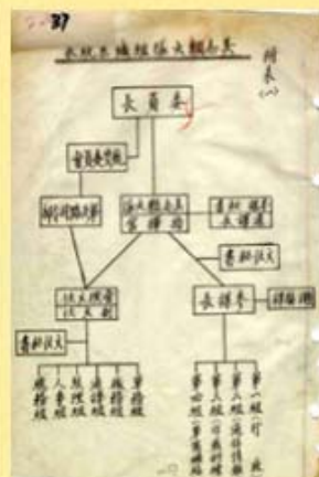
圖6 美國志願大隊組織表 檔號：0026/152.1/2320 案名：外籍空軍志願隊參加抗日戰史 來源機關：國防部史政編譯局 管有機關：檔案管理局