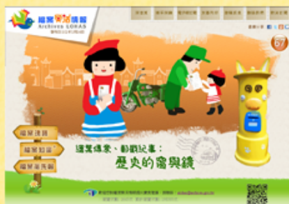
檔案樂活情報第67期首頁