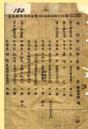
圖7 美國志願大隊飛行員擊毀日機紀錄 檔號：0026/152.1/2320 案名：外籍空軍志願隊參加抗日戰史