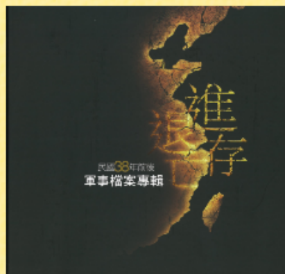
進退存亡-民國38年前後軍事檔案專輯