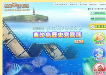
檔案樂活情報第64期首頁