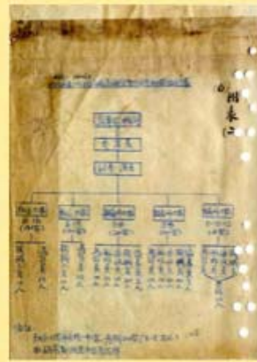
圖3 蘇俄志願隊組織表 (民國27-28年) 檔號：0026/152.1/2320 案名：外籍空軍志願隊參加抗日戰史 來源機關：國防部史政編譯局 管有機關：檔案管理局