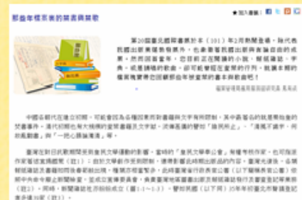
檔案樂活情報第57期檔案瑰寶

因國家檔案涵括國家安全、公共資源管理、財經事務、教育文化科技、社會發展、府院事務及地方事務等7大類，所以，可結合的大學通識課程也相對的完整，除了可作歷史類課程之核心資料外，檔案內容之撰寫體例也可作為應用中文類課程之範本，更可延伸至社會、政治、法學、經濟等相關課程。值得一提的是，文學藝術類課程也能在國家檔案中汲取養分，例如：從〈那些年檔案裏的禁書與禁歌〉看歌曲如何運用隱喻表情達意成為人們的寄託，及當時時代的氛圍。又如：從《時貳廳：電影與檔案的初邂逅—探尋國家寶藏》看如何以影像說話，說時代的故事。