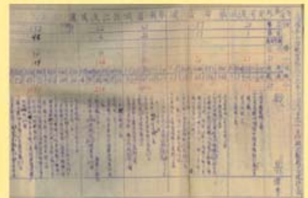
圖12 美國第14航空隊戰果 (民國33年12月) 檔號：0033/544.2/8043 案名：美十四航空隊在華戰果統計表 來源機關：國防部史政編譯局 管有機關：檔案管理局

飛虎隊在短暫但榮耀的歲月裡，隊員以個人身分參加，不僅無軍銜，亦無編制，甚至沒有統一的軍服；但在陳納德將軍的領導之下，這支臨時組成的外籍飛行隊，在與日本空中作戰時連戰皆捷。飛虎隊以少數的人員、飛機面對數量眾多的日機與船艦，仍毫無畏懼勇往前進，以優異的技術，屢挫強敵，寫下輝煌空戰史頁。想要知道有關飛虎隊更多的故事嗎？歡迎您到國家檔案資訊網找尋飛虎隊的足跡。