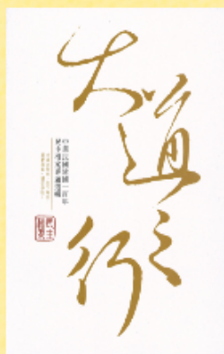
大道之行—中華民國建國 一百年民主檔案專題選輯