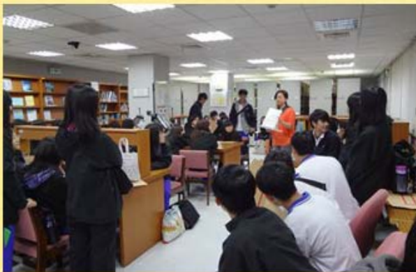
臺北市立成淵高中參訪本局

大陸第一歷史檔案館胡館長旺林應國立故宮博物院邀請來臺，並於102.02.27率該館相關人員拜訪本局。