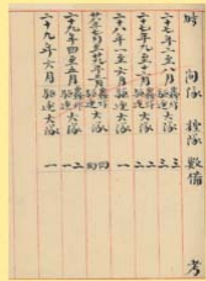
圖4 蘇俄志願隊援華情況 檔號：0026/152.1/2320 案名：外籍空軍志願隊參加抗日戰史

當時我國空軍，雖有外籍飛行員與蘇俄志願隊的協助，然仍難以抗衡日軍的空中優勢，同時也造成地面部隊遭受空軍威脅致使戰況膠著。尤其，當日本零式戰鬥機投入中國大陸戰場後，我空軍在飛機性能及人員上已無法和日本相較，國民政府乃委託擔任顧問的陳納德將軍赴美洽購飛機，並招募飛行員來華參戰。