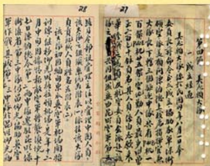
圖5 美國志願大隊成立經過 檔號：0026/152.1/2320 案名：外籍空軍志願隊參加抗日戰史 來源機關：國防部史政編譯局 管有機關：檔案管理局

由於陳納德顧問在美招募美國陸海軍飛行員及獲得百餘架戰鬥機，隨即於30年8月成立「中華民國空軍美國志願援華航空隊 (American Volunteer Group 簡稱AVG)」，乃之後所稱「飛虎隊」。在緬甸冬瓜英空軍基地開始訓練，劃分為3個中隊，正式投入中國大陸的空中戰場。AVG成立後，原駐防昆明協助滇、緬地區的空戰，後移防至湘桂地區。31年珍珠港事變，美國向日本宣戰後提供我國軍事援助，並規劃派遣航空隊來華。合約僅1年的AVG於31年到期解散，部分成員歸建美軍後，飛虎隊就此劃下句點。當時AVG以少數的人員、優異的技術參與多次空戰並擊落日機、炸毀倉庫及卡車等，其戰果彪炳，我國頒發勳獎章予以獎勵 (圖5~11)。