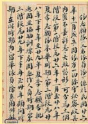
圖2 蘇俄志願隊成立經過 檔號：0026/152.1/2320 案名：外籍空軍志願隊參加抗日戰史