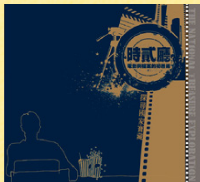
時貳廳：電影與檔案的初邂逅