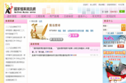
國家檔案資訊网首页

檔案管理局開放於網路的「檔案樂活情報」，內容以大眾關注之議題為主，以簡潔文字介紹，再配合檔案圖像、老照片等相關資料，使檔案不只是平面文字的敘述，更是圖文並茂的立體呈現，展現檔案活化的精神。在課程時間有限，而學習無限的情況下，若能設計學習單，使學生善用檔案管理局開放的網路資源，進行國家檔案的線上檢索，了解更多檔案的故事，實可成為學生延伸學習的空間。