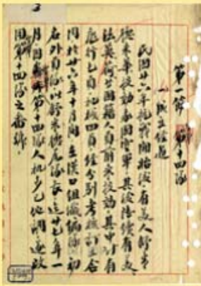
圖1 空軍第14隊成立經過 檔號：0026/152.1/2320 案名：外籍空軍志願隊參加抗日戰史