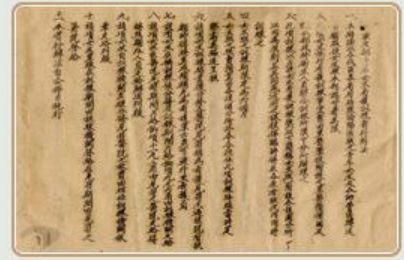
圖5 檔號：0028/800.2/3750 案名：軍政部青年女生看護訓練辦法 來源機關：國防部史政編譯局 管有機關：國家發展委員會檔案管理局

在此期間，政府也重視傷兵的慰勞，設置傷兵慰問組，負責全國傷兵慰勞、探視、犒賞事宜；另一方面，地方各界亦自發性組織慰勞團體探視傷兵，並提供換藥、縫衣、代寫家書服務(圖6)。在政府與民間共同努力下，這些傷兵進行療養之際，亦得到心靈撫慰與溫暖。