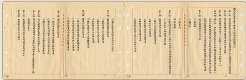
圖6 檔號：0032/021.1/3750.11 案名：軍委會傷兵慰問組組織職掌編制案 來源機關：國防部史政編譯局 管有機關：國家發展委員會檔案管理局

在此期間，政府也重視傷兵的慰勞，設置傷兵慰問組，負責全國傷兵慰勞、探視、犒賞事宜；另一方面，地方各界亦自發性組織慰勞團體探視傷兵，並提供換藥、縫衣、代寫家書服務(圖6)。在政府與民間共同努力下，這些傷兵進行療養之際，亦得到心靈撫慰與溫暖。