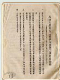
圖7 檔號：0028/800.2/3750 案名：軍政部青年女生看護訓練辦法 來源機關：國防部史政編譯局 管有機關：國家發展委員會檔案管理局

抗戰期間，國軍傷兵救援行列中，除了軍醫與各地民間人力的投入外，亦有外國衛生人員藉由中外慈善團體的名義，參與救護工作(圖7、圖8)。至29年，「中央傷兵管理處」改組為「榮譽軍人總管理處」，轉以榮譽軍人稱呼傷兵，而傷兵業務、待遇與福利亦臻完善(圖9)。傷兵經過治療後，若尚能從事戰鬥行為者，可以返歸原本的部隊報到，或是選擇至新部隊服務。倘若傷勢太過嚴重而無法重回戰場者，則可轉至殘廢教養院等後勤單位。