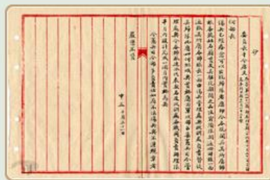
圖1 檔號：0026/0256.3/5001 案名：抗日受傷官兵愈歸隊辦法 來源機關：國防部史政編譯局 管有機關：國家發展委員會檔案管理局

對日抗戰爆發前，我國傷兵管理是由各軍事醫院、戰區、兵站，以及軍醫署駐外辦事處等單位自行負責，管理方式不盡相同，而且僅有數省設有傷兵教養院，收容受傷的軍人。抗戰爆發之際，中央政府重視全國傷兵管制，明令憲兵司令部監控各地傷兵從休養至歸隊期間，必須遵守相關規定，倘若有不法行徑，給予嚴厲懲罰（圖1、圖2）。