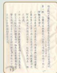
圖3 檔號：0028/800.2/6355 案名：戰時醫院治癒士兵出院處理規程

「中央傷兵管理處」統合各省傷兵管理單位，在各地設立傷兵管理及收容分支機構，例如各戰區傷兵管理分處、各戰區（省衛戍區）傷兵管理處（所）以及各省黨政軍聯合管理委員會等單位，負責傷兵收容、治療事務。另外，在傷兵教養方面，設有殘廢院、盲殘院、墾殖園、殘廢軍民工廠、實驗工廠、實驗農場，對因戰爭傷殘而無法再踏上戰場的士兵，輔導從事其他行業，並予以適當安置（註2）、（圖3）。