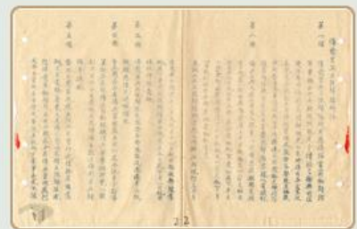
圖2 檔號：0026/0256.3/5001 案名：抗日受傷官兵愈歸隊辦法 來源機關：國防部史政編譯局 管有機關：國家發展委員會檔案管理局

為妥適救護與管理傷兵，26年9月，軍政部頒布〈戰時傷病士兵處理暫行辦法〉、〈戰時傷病軍官佐處理暫行辦法〉，統一傷兵入院辦法與轉院規則，明示傷兵領餉、傷癒歸隊及轉送殘廢院之規定。10月，軍政部成立「中央傷兵管理處」，成為戰時傷兵收容的最高單位，亦開啟全國傷兵統一管理的機制（註1）。