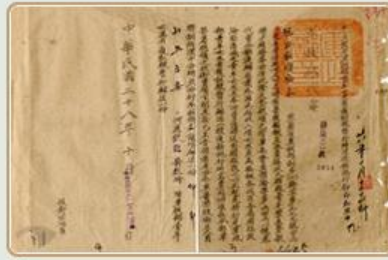
圖4 檔號：0028/800.2/3750 案名：軍政部青年女生看護訓練辦法

傷兵在收容單位，接受軍醫或軍隊醫護人員的治療、照顧。然而，隨著戰火日益激烈，國軍受傷人數攀升，致使醫護人手出現嚴重不足的現象。因此，軍政部開始招募戰區、淪陷區自願擔任救護工作的女青年，加入傷兵救援的行列(圖4)。這些女青年接受軍政部的安排，進行6個月訓練，並可按月獲得薪餉，結訓之後，即被分發到各醫院擔任看護見習生，待有軍隊看護員出缺時便立刻補任，補充醫護人力(圖5)。