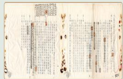
圖9 檔號：0028/800.2/6355 案名：戰時醫院治癒士兵出院處理規程

我國在抗戰期間，除戰場上講求制敵機先，亦漸重視傷兵的救護與管理，以提供軍隊的再生力，使這些傷兵痊癒之後能夠繼續在戰場上發揮高貴的戰鬥力。國家檔案擁有豐富的國軍抗戰資料，想要瞭解更多我國抗戰或傷兵救護的事蹟嗎？歡迎前往 國家檔案資訊網 查詢。