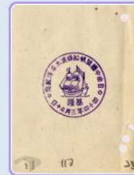
圖11 檔號：0039/833/1 案名：紀念郵戳 來源機關：中華郵政股份有限公司 管有機關：國家發展委員會檔案管理局

在此之後，「自由中國號」捐贈給舊金山海事博物館(圖12)，停留美國56年，直到101年我國正視其歷史意義，透過諸多聯繫管道購回船隻，以保持此項文化資產。今日，「自由中國號」停駐在基隆國立海洋博物館，讓世人見證60年前其不畏艱難完成夢想的精神。目前，國家發展委員會檔案管理局在國史館臺灣文獻館舉辦「案藏瑰寶：國家檔案菁華展」，展示著「自由中國號」精彩事蹟，歡迎前往參觀，並可透過 國家檔案資訊網 ，與我們一起探索國家寶藏。