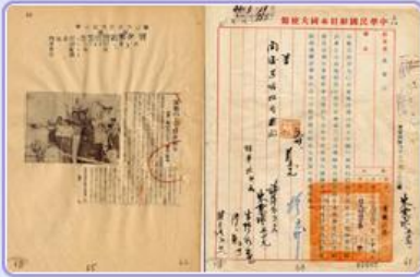
圖4 檔號：0044/443.5/9 案名：自由中國號帆船輸美 來源機關：外交部 管有機關：國家發展委員會檔案管理局