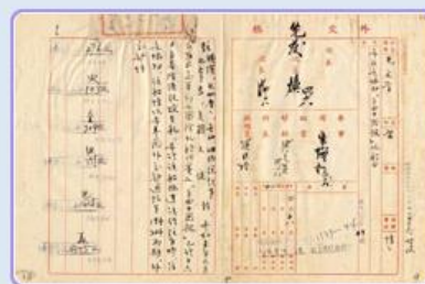
圖2 檔號：0044/443.5/9 案名：自由中國號帆船輸美 來源機關：外交部 管有機關：國家發展委員會檔案管理局

「自由中國號」原名「勝孝利號」，係28年在福州馬尾船廠出廠，輾轉賣到臺灣。周傳鈞以新臺幣(以下同)46,000元買下後，爭取其他資金來修復船體。原本，基隆市政府允贊助20,000元，惟須改名「基隆號」；後來，臺灣省政府支援45,000元，並將船名登記為「自由中國號」，以象徵自由的中華民國。44年4月4日，「自由中國號」在基隆碼頭舉行隆重的啟航典禮，空氣中瀰漫著一股令人興奮的氣息，現場萬人鑼動，注視著這艘備受禮遇的帆船，在漁管處「漁定輪」拖引下出港，並有基隆港務局等9艘船隻陪同，以及海軍「五四艦」、「五四五砲艇」在側護送(註2)。