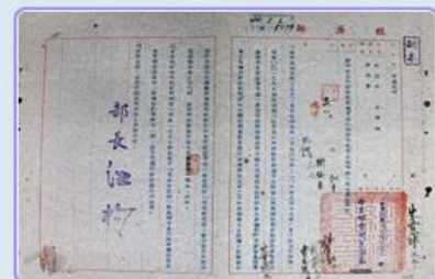
圖12 檔號：0044/443.5/10 案名：自由中國號帆船輸美 來源機關：外交部 管有機關：國家發展委員會檔案管理局

在此之後，「自由中國號」捐贈給舊金山海事博物館(圖12)，停留美國56年，直到101年我國正視其歷史意義，透過諸多聯繫管道購回船隻，以保持此項文化資產。今日，「自由中國號」停駐在基隆國立海洋博物館，讓世人見證60年前其不畏艱難完成夢想的精神。目前，國家發展委員會檔案管理局在國史館臺灣文獻館舉辦「案藏瑰寶：國家檔案菁華展」，展示著「自由中國號」精彩事蹟，歡迎前往參觀，並可透過 國家檔案資訊網 ，與我們一起探索國家寶藏。