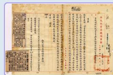
圖3 檔號：0044/443.5/9 案名：自由中國號帆船輸美 來源機關：外交部 管有機關：國家發展委員會檔案管理局

「自由中國號」揚帆出港，未料幾天後即遭受強風襲擊，被迫返航修繕。4月16日，船隻再從基隆出發，又於一周後在海上遭遇颱風，船身受損嚴重、載浮載沉，直到被美軍發現後拖往沖繩島。臺灣方面希望「自由中國號」在完成船體修理後，駛返基隆(圖3)。然而，船員們依舊堅持理想、無畏風雨，動身航往橫濱，受到當地華僑熱烈的歡迎(圖4、圖5、圖6)。