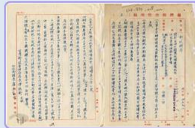
圖10 檔號：0039/833/1 案名：紀念郵戳 來源機關：中華郵政股份有限公司 管有機關：國家發展委員會檔案管理局

「自由中國號」未能趕上國際帆船大賽，仍完成兩項重要任務。第一，臺灣郵政管理局交付兩袋郵件，都蓋上了「自由中國號帆船橫渡太平洋紀念」郵戳，成功送抵舊金山郵局(圖10、圖11)。第二，臺灣水產試驗所託付300支瓶中信，內有便條請拾獲者寄回，由船員每隔6個小時丟入海中，用以測試洋流的變化(註3)。