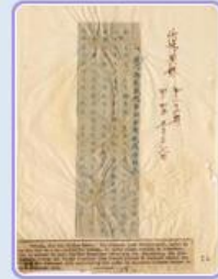
圖6 檔號：0044/443.5/9 案名：自由中國號帆船輸美 來源機關：外交部 管有機關：國家發展委員會檔案管理局

「自由中國號」船體殘破，機具毀損嚴重，必須在橫濱進行大整修，船員們也藉機徵募遠航經費。6月17日，「自由中國號」從橫濱啟航，儘管國際帆船賽早已揭幕，卻未澆熄船員的熱情，堅持完成橫渡太平洋的目標。「自由中國號」無懼太平洋海象險峻，突破風雨交加、波濤洶湧的挑戰，克服彈盡援絕的窘境(圖7)，歷經53天航程，終於在8月8日抵達舊金山，完成渡越太平洋的壯舉，受到美國各方的讚揚(圖8、圖9)。