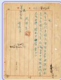
圖8 檔號：0044/443.5/9 案名：自由中國號帆船輸美 來源機關：外交部 管有機關：國家發展委員會檔案管理局