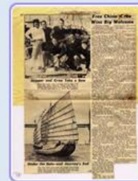
圖9 檔號：0044/443.5/9 案名：自由中國號帆船輸美

「自由中國號」未能趕上國際帆船大賽，仍完成兩項重要任務。第一，臺灣郵政管理局交付兩袋郵件，都蓋上了「自由中國號帆船橫渡太平洋紀念」郵戳，成功送抵舊金山郵局(圖10、圖11)。第二，臺灣水產試驗所託付300支瓶中信，內有便條請拾獲者寄回，由船員每隔6個小時丟入海中，用以測試洋流的變化(註3)。