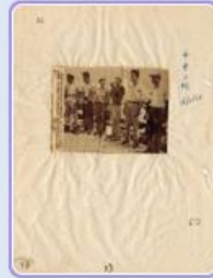
圖5：本國五青年駕駛的自由中國號抵達日本橫濱 檔號：0044/443.5/9 案名：自由中國號帆船輸美 來源機關：外交部 管有機關：國家發展委員會檔案管理局