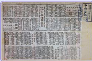
圖7 檔號：0044/443.5/10 案名：自由中國號帆船輸美 來源機關：外交部 管有機關：國家發展委員會檔案管理局

「自由中國號」船體殘破，機具毀損嚴重，必須在橫濱進行大整修，船員們也藉機徵募遠航經費。6月17日，「自由中國號」從橫濱啟航，儘管國際帆船賽早已揭幕，卻未澆熄船員的熱情，堅持完成橫渡太平洋的目標。「自由中國號」無懼太平洋海象險峻，突破風雨交加、波濤洶湧的挑戰，克服彈盡援絕的窘境(圖7)，歷經53天航程，終於在8月8日抵達舊金山，完成渡越太平洋的壯舉，受到美國各方的讚揚(圖8、圖9)。