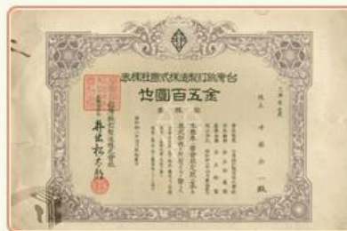
圖8 檔號：0035/1098/0 案名：工礦印刷紙業分公司第一、二、三、四、五造紙廠工礦印刷紙業分公司第一、二油墨廠人事土地房屋清冊 來源機關：臺灣省農工企業股份有限公司 管有機關：國家發展委員會檔案管理局