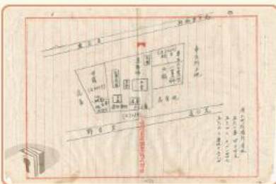
圖7 檔號：0035/1/0 案名：農林公司接收日人會社牧場商店移交清冊 來源機關：臺灣省農工企業股份有限公司 管有機關：國家發展委員會檔案管理局