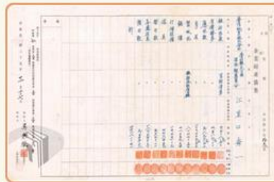
圖5 檔號：0035/1066/0 案名：工礦-昭和纖維及台灣紙業會社接收清冊 來源機關：臺灣省農工企業股份有限公司 管有機關：國家發展委員會檔案管理局