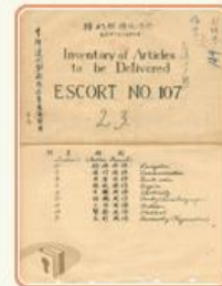
圖6-1 檔號：0035/771.4/6010.3 案名：日艦接收清冊 來源機關：國防部史政編譯局 管有機關：國家發展委員會檔案管理局