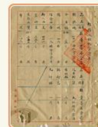
圖12 檔號：0034/628.4/4010 案名：臺澎金馬區沉船及物資打撈案 來源機關：國防部史政編譯局 管有機關：國家發展委員會檔案管理局