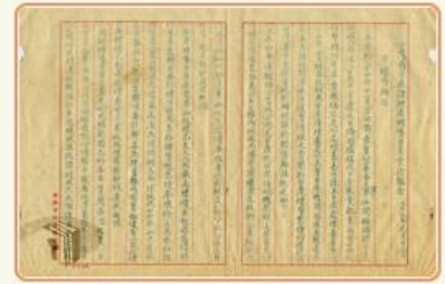
圖3 檔號：0037/4/3-2 案名：三十七年一月六月會議紀錄(駐會) 來源機關：臺灣省諮議會 管有機關：國家發展委員會檔案管理局

臺灣光復後的日產接收，可分為日本政府的公有財產、日人私有財產及工礦農林等企業財產3種，辦理接收作業時，均應填具原始清冊一式3份，並由接收機關、接收人及被接收人分別蓋印確認，作為日產移轉之依據(圖4、圖5、圖6-1、圖6-2、圖7、圖8、圖9)。接收之日產，經專門技術人員組成之評估小組估定底價後，以公告標售方式處理；投標人得標後，由日產處理委員會會同原接收機關辦理點交，並發給產權移轉證明書。此外，屬臺日合資企業及涉產權設定者，則由日產清算委員會進行清算作業。