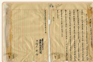
圖11 檔號：0034/628.4/4010 案名：臺澎金馬區沉船及物資打撈案 來源機關：國防部史政編譯局 管有機關：國家發展委員會檔案管理局