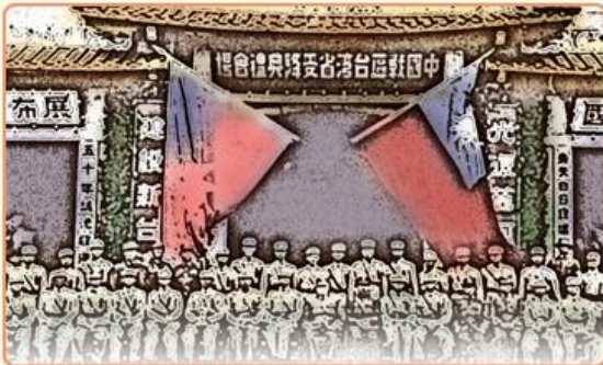
民國34年10月中國戰區臺灣省受降典禮

民國34年10月臺灣光復後，政府首要面臨的即是接收工作，主要分成軍事接收、行政接收與日產接收等三大部分，其中辦理日產接收工作的機關為何？接管程序如何進行？透過本文的介紹，讓我們一同瞭解光復後臺灣日產接收的情形吧！