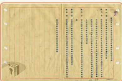
圖10 檔號：0034/002.6/4010.2 案名：台灣光復案專輯 來源機關：國防部史政編譯局 管有機關：國家發展委員會檔案管理局

由於臺灣是日本南進政策的重要中繼點，日本撤離臺灣時，民間多有日本政府將物資埋藏於地下及港口等傳言，且依臺灣省行政長官公署獎勵打撈各港沉沒物資辦法規定，發現日人物資沉沒於港口者，得密報各港務局核准後會同打撈，所得物資除去打撈費用外，可得百分之十酬勞金(圖10)，因此屢有民眾申請挖掘或打撈埋沉之財物案件(圖11、圖12)。