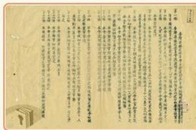
圖1 檔號：0035/012.8/63 案名：日產會修正組織規程 來源機關：臺灣省文獻委員會 管有機關：國家發展委員會檔案管理局

由於日本統治臺灣達50年之久，有關財產接收工作相當繁重，且日僑遣送後，處理日人私有財產接收業務亦屬繁雜，故於35年1月，在接收委員會下特別設置日產處理委員會，並在17個縣市成立分會，專責日人財產接收工作(圖1、圖2)；同年7月，另設日產標售委員會及日產清算委員會，掌理接收日產之估價、標售及企業與金融機構之債權債務清算事宜。36年4月，日僑遣返及日產接收工作皆大致完成，日產處理委員會與下轄機構結束工作。