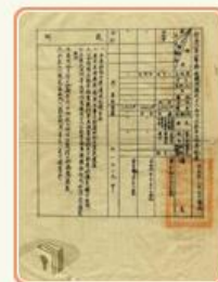
圖9 檔號：0035/267.2/16 案名：接收日人在台私有土地 來源機關：內政部警政署 管有機關：國家發展委員會檔案管理局

由於臺灣是日本南進政策的重要中繼點，日本撤離臺灣時，民間多有日本政府將物資埋藏於地下及港口等傳言，且依臺灣省行政長官公署獎勵打撈各港沉沒物資辦法規定，發現日人物資沉沒於港口者，得密報各港務局核准後會同打撈，所得物資除去打撈費用外，可得百分之十酬勞金(圖10)，因此屢有民眾申請挖掘或打撈埋沉之財物案件(圖11、圖12)。