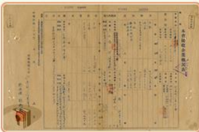
圖4 檔號：0035/266.2/6 案名：報告接收日產企業公司 來源機關：臺灣省文獻委員會 管有機關：國家發展委員會檔案管理局