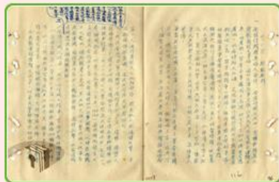
圖11 檔號：0038/543.6/8010.2 案名：金門戰亂戰役案 來源機關：國防部史政編譯局 管有機關：國家發展委員會檔案管理局