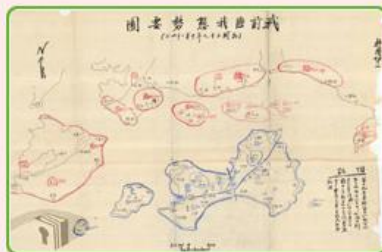
圖1 檔號:0038/543.6/8010.2 案名:金門戰亂戰役案 來源機關:國防部史政編譯局 管有機關:國家發展委員會檔案管理局

國共戰爭後期,國軍未傳捷報,共軍節節進逼。值此國家動盪風雨飄搖之際,國軍在民國(以下同)38年10月底於金門積極備戰,成功擊潰進犯的共軍(圖1、圖2、圖3),擄獲大批戰利品(圖4),史稱「古寧頭戰役」或「金門戰役」(以下行文以古寧頭戰役稱之)。這場勝利改變國軍戰役情勢,穩定臺海戰局,軍民士氣為之一振(圖5)。