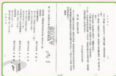
圖3 檔號:0038/1843/8010 案名:金門戰役及古寧頭戰鬥史