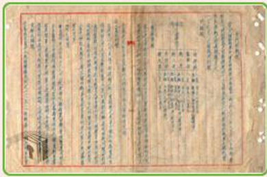
圖6 檔號：0038/543.6/8010.2 案名：金門戰亂戰役案

共軍於10月25日凌晨時分偷襲金門，戰一營的排長楊展及其部屬（計3輛戰車）由於前一天演習時戰車履帶陷入沙地，停留在海灘修理，因此率先發現共軍登陸，隨即在黑暗中奮力迎戰（註2），立下古寧頭戰役的首功。上級獲報後，下令戰一營的其他戰車，協同步兵部隊前往作戰（圖8）。