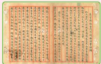
圖5 檔號:0038/543.6/8010.2 案名:金門戰亂戰役案 來源機關:國防部史政編譯局 管有機關:國家發展委員會檔案管理局

國軍當時派遣戰車第三團第一營(以下簡稱戰一營)進駐金門,戰一營的M5A1戰車接收自美軍,共計22輛,全營約400餘名官兵,在古寧頭戰役的反登陸作戰,發揮克敵制勝的關鍵效果,因此獲頒「金門之熊」的榮譽錦旗(註1)。透過爬梳國家檔案的相關紀錄,我們對國軍裝甲兵在古寧頭戰役的作戰狀況,能有更深一層的認識。