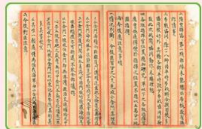
圖10 檔號：0038/543.6/8010.2 案名：金門戰亂戰役案 來源機關：國防部史政編譯局 管有機關：國家發展委員會檔案管理局