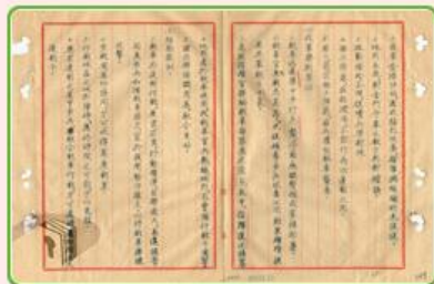
圖9 檔號：0038/543.6/8010.2 案名：金門戰亂戰役案 來源機關：國防部史政編譯局 管有機關：國家發展委員會檔案管理局

M5A1戰車在古寧頭戰役中，具有重要作用。這場戰役對國軍而言屬於反登陸作戰，而反登陸作戰可區分為四階段目標：第一階段為「拒敵於彼岸」，第二階段為「擊敵於半渡」，第三階段為「毀敵於灘頭」，第四階段為「殲敵於陣內」（圖11）。當時大批共軍渡海夜襲金門，隨著國軍在金門海岸的防線遭到登陸共軍趁隙攻入後（圖12），反登陸作戰進入第四階段，共軍在金門島上的古寧頭地區一帶流竄，所幸有裝甲兵以火力支援國軍的反擊，殘餘共軍最後遭到圍剿而戰敗。