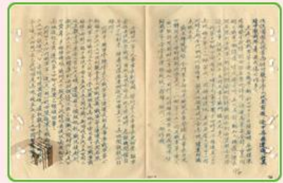
圖8 檔號：0038/543.6/8010.2 案名：金門戰亂戰役案

當時M5A1戰車並無夜視設備，實不利夜間作戰（圖9），所幸戰一營經過一個多月的訓練與演習，早已熟悉金門地形，在黑夜中憑著戰車之前在泥土路上壓出的履帶痕跡，以及步兵的引導，突破重重困難前進戰場，抵禦共軍（註3）。