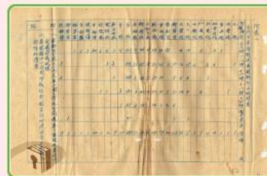
圖4 檔號:0038/543.6/8010.2 案名:金門戰亂戰役案 來源機關:國防部史政編譯局 管有機關:國家發展委員會檔案管理局