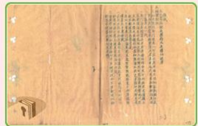
圖12 檔號：0038/543.6/8010.2 案名：金門戰亂戰役案 來源機關：國防部史政編譯局 管有機關：國家發展委員會檔案管理局

古寧頭戰役中，登陸的共軍不是慘遭殲滅，就是在國軍的心戰喊話下投降，連共軍將領都認為這是一場「完敗的戰役」（註5），因此這段光榮的戰史，列入國軍裝甲兵史上的「四大戰役」之一。對中華民國而言，古寧頭戰役扭轉國共戰局，確保日後臺灣的長期安全，奠定我國穩定發展的基石。想瞭解更多國軍的故事嗎？本局移轉自國防部史政編譯局的國家檔案長達300多公尺，時間範圍則以民國38年以前為主，歡迎前往國家檔案資訊網進一步搜尋！