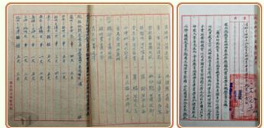
圖1 檔號：0035/114/0001 案名：考察參觀實習旅行案 來源機關：教育部 管有機關：國家發展委員會檔案管理局

民國26年抗日戰爭爆發後，學校教育的推動瀕臨困境，遑論實習課程的落實。至戰事結束後，全國大專院校才得以再開始辦理實習教育，讓學生能將課堂學習的成果應用在實務上。從本局典藏的教育部檔案中，可瞭解當時各校實習經費申請、參與人員名錄(圖1)、實習課程規劃(圖2)、實習機關申請答覆、實習機關授業規劃(圖3)、實習旅行路程規劃、學生實習報告等(圖4)，涵蓋文、理、法、商、醫、農、工、軍、警、師範、護理等科目，而實習場域也多以鄰近省分為主，以節省經費支出(圖5)。