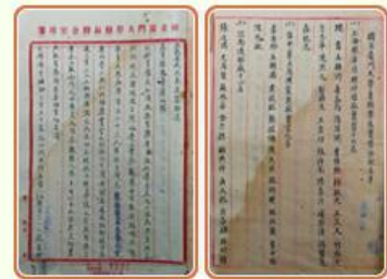
圖8 檔號：0035/140.36-14/0001 案名：國立廈門大學考察參觀實習旅行案 來源機關：教育部 管有機關：國家發展委員會檔案管理局

由此可見，抗戰結束後，政府力圖復原高等教育，連同輔助的實習教育亦不偏廢，惟各省遭戰爭破壞、百廢待興，使臺灣成為各校爭取校外實習場域的現象。