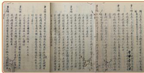
圖3 檔號：0035/114/0001 案名：考察參觀實習旅行案 來源機關：教育部 管有機關：國家發展委員會檔案管理局