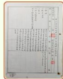
圖4 檔號：0035/114/0001 案名：考察參觀實習旅行案 來源機關：教育部 管有機關：國家發展委員會檔案管理局