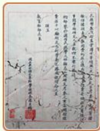
圖6 檔號：0037/146.09-14/0001 案名：國立東方語文專科學校考察參觀實習旅行案 來源機關：教育部 管有機關：國家發展委員會檔案管理局

實習學生抵臺後，因學科差異，而被分配到不同的機關進行實習。以廈門大學為例，具有土木、機械背景的學生被分配至基隆港務局、臺灣鐵路管理局、臺中第三飛機製造廠等單位，化學系師生則組成臺灣化學工業參觀團，參觀臺灣國營、省營化學工廠，以收琢磨之效（圖8）。