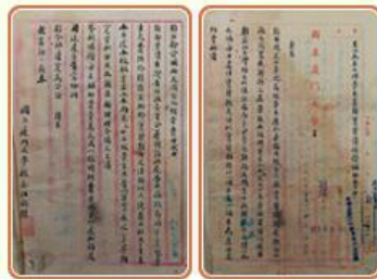
圖7 檔號：0035/140.36-14/0001 案名：國立廈門大學考察參觀實習旅行案 來源機關：教育部 管有機關：國家發展委員會檔案管理局