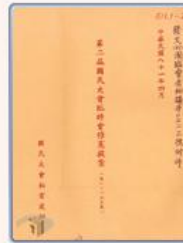
圖5 檔號：0081/511/1 案名：代表(一般、修憲)提案 來源機關：國民大會 管有機關：國家發展委員會檔案管理局