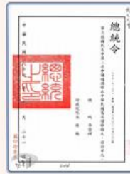
圖6 檔號：0086/513/1 案名：各種會議紀錄、速紀錄等 來源機關：國民大會 管有機關：國家發展委員會檔案管理局