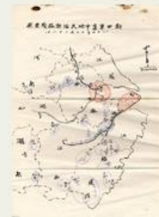
圖3 新四軍集中地及活動路線要圖 檔號：0026/583.2/4 案名：陸軍新編第四軍收編案 來源機關：國防部史政編譯局 管有機關：國家發展委員會檔案管理局