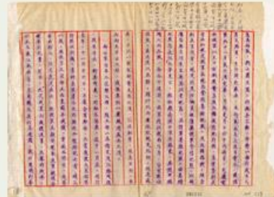
圖6 檔號：0027/013.13/0292 案名：新四軍案