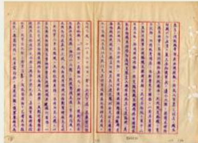
圖5 檔號：0027/013.13/0292 案名：新四軍案 來源機關：國防部史政編譯局 管有機關：國家發展委員會檔案管理局