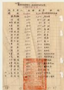
圖2 檔號：0026/583.2/4 案名：陸軍新編第四軍收編案 來源機關：國防部史政編譯局 管有機關：國家發展委員會檔案管理局