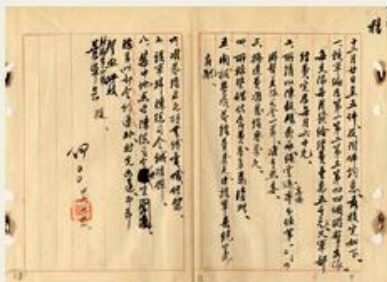
圖1 檔號：0026/583.2/4 案名：陸軍新編第四軍收編案 來源機關：國防部史政編譯局 管有機關：國家發展委員會檔案管理局

新四軍原係共軍在江西、福建、廣東、湖南、湖北、河南、浙江、安徽等八省活動的游擊隊，經編組後成立4個游擊支隊，員額有16,400人，由葉挺與項英擔任正、副軍長，接受中央軍餉(圖1、圖2)。政府因應抗戰形勢，將新四軍編入第三戰區，由司令顧祝同指揮，並賦予在各省邊區以游擊方式牽制日軍，以及協防南京、上海的任務(圖3)。