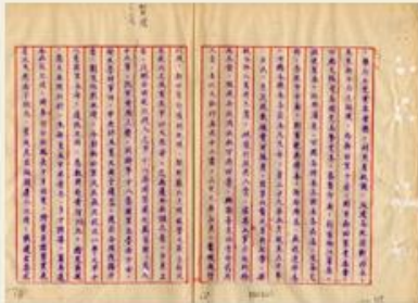
圖4 檔號：0027/013.13/0292 案名：新四軍案 來源機關：國防部史政編譯局 管有機關：國家發展委員會檔案管理局

28年起，八路軍整編後，東渡黃河，協防華北，表面上服從政府，卻因爭奪地盤而與國軍較勁。29年中，新四軍與國軍衝突日起，逐漸將勢力擴展至長江以南，與八路軍隔江呼應。10月，新四軍與國軍在黃橋短兵相接，戰況激烈。後來，政府為防堵共軍坐大，令新四軍在限期之內移往黃河以北，藉以牽制(註2)(圖4)。對此，葉挺要求先針對行軍路線、軍隊安全、軍備換發，以及各項費用進行協商後，再行遷移。11月26日，顧祝同以軍隊北調與請求補給係屬兩事，嚴正告知新四軍務必在年底完成，屆時再斟酌情況給予經費補助(圖5)。隨後，葉挺則以日軍已察覺移防消息，無意北移，並持續擴充地方政治勢力(圖6)。