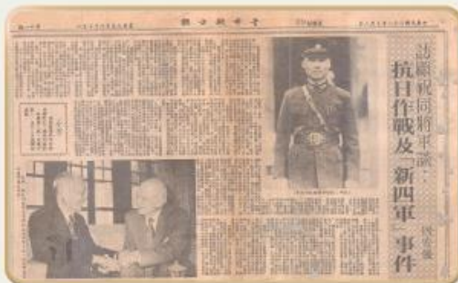
民國68年7月《青年戰士報》報導顧祝同將軍談新四軍事件(註1)

民國26年7月，盧溝橋事變爆發後，國民政府納編共軍，一同抗日。然而，中共在敵後地區擴展勢力，與國軍時有磨擦，甚至引發武力衝突，新四軍事件即為其中之一。現在，就讓我們循著國家檔案，瞭解事件發展及其影響。