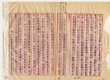
圖8 檔號：0027/013.13/0292 案名：新四軍案 來源機關：國防部史政編譯局 管有機關：國家發展委員會檔案管理局

國軍聯合圍剿戰術奏效，阻斷補給線，一舉擊潰新四軍、擄獲葉挺，史稱「新四軍事件」。30年1月17日，軍事委員會明令取消新四軍的番號(圖8)，政府考量到中日緊張的情勢，尚未與中共決裂。而從後來葉挺的談話紀錄，可知事件實出於中共計畫，而非其個人所能左右(圖9)。由此可見，在抗日戰爭期間，中共透過與政府合作抵禦日本侵略，實則暗地擴張勢力，也證實其「七分發展、二分應付、一分抗日」的策略(註3)。