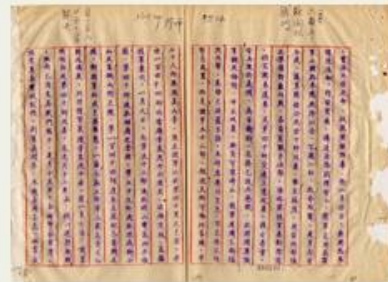
圖7 檔號：0027/013.13/0292 案名：新四軍案 來源機關：國防部史政編譯局 管有機關：國家發展委員會檔案管理局