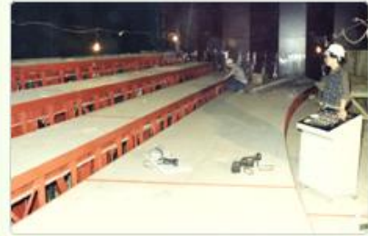
圖8 檔號：0076/0110102/018 案名：中正文化中心國劇院、音樂廳工程 來源機關：榮民工程股份有限公司 管有機關：國家發展委員會檔案管理局

兩廳院實際建造的建築結構、消防排水工程由行政院國軍退除役官兵輔導委員會榮民工程事業管理處承辦(註3)，並由中興工程顧問社進行工程協調與監督(圖9、10)。中興工程顧問社向政府報告兩廳院之施工問題，包括「音樂廳部分席位不合最佳音響標準，及實驗劇場的視線與舞臺位置未臻理想，經德荷顧問組音響專家之建議，減少部分席位」、「國家劇院及音樂廳內之廚房設計，擬予以刪除，以確保建築物之環境衛生」、「音樂廳內是否設置管風琴」等(註4)。此外，當時兩廳院受限於建築法規，使得工程無法順利進行，最後以等同中正紀念堂「紀念性建築物」作為建設依據，才得以如期完工(圖11)。從設計概念到執行落實，透過政府各單位共同努力，終於完成這座獨一無二的國際級展演場館(圖12)。