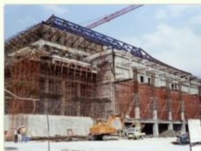
圖10 檔號：0074/0110102/CP2238 案名：中正紀念堂音樂廳工程 來源機關：榮民工程股份有限公司 管有機關：國家發展委員會檔案管理局