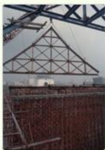
圖9 檔號： 0074/0110102/CP2219 案名：中正紀念堂音樂廳工程

兩廳院實際建造的建築結構、消防排水工程由行政院國軍退除役官兵輔導委員會榮民工程事業管理處承辦(註3)，並由中興工程顧問社進行工程協調與監督(圖9、10)。中興工程顧問社向政府報告兩廳院之施工問題，包括「音樂廳部分席位不合最佳音響標準，及實驗劇場的視線與舞臺位置未臻理想，經德荷顧問組音響專家之建議，減少部分席位」、「國家劇院及音樂廳內之廚房設計，擬予以刪除，以確保建築物之環境衛生」、「音樂廳內是否設置管風琴」等(註4)。此外，當時兩廳院受限於建築法規，使得工程無法順利進行，最後以等同中正紀念堂「紀念性建築物」作為建設依據，才得以如期完工(圖11)。從設計概念到執行落實，透過政府各單位共同努力，終於完成這座獨一無二的國際級展演場館(圖12)。