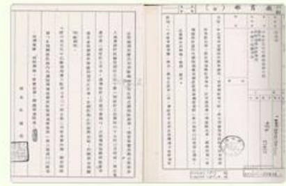
圖5 檔號：0069/A-3.6.5.12.4/01 案名：國家劇院與音樂廳新建工程 來源機關：行政院經濟建設委員會 管有機關：國家發展委員會檔案管理局

當時政府委由「德荷顧問組」，即西德奇鉅公司與荷蘭飛利浦公司兩個外國專家團隊，建置兩廳院內部音響、燈光以及舞臺設備，使用當時的最新專業技術，並配合兩廳院的建築形貌，提供從設備採購、供應、安裝與設計的統包服務，以確保兩廳院設備系統品質具備國際級的專業水準(註1)(圖5、6)，例如兩廳院的舞臺為電動控制組合升降臺及活動插入式升降臺，以製造不同的舞臺效果；音樂廳則擁有當年亞洲最大的管風琴(圖7)；而觀眾席的每一張座位腳椅都是空調出風口，讓四周的室內溫度能達到平均(註2)(圖8)。