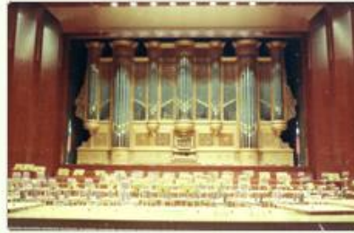
圖7 檔號：0076/0110102/087 案名：中正紀念堂德荷小組完工 來源機關：榮民工程股份有限公司 管有機關：國家發展委員會檔案管理局