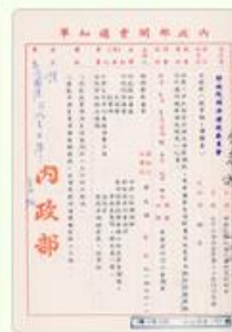
圖11 檔號： 0069/A-3.6.5.12.4/01 案名：國家劇院與音樂廳新建工程 來源機關：行政院經濟建設委員會 管有機關：國家發展委員會檔案管理局