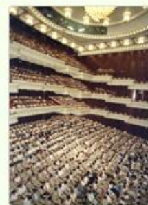
圖12 檔號：0076/0110102/062 案名：中正文化中心國劇院正式測試工程 來源機關：榮民工程股份有限公司 管有機關：國家發展委員會檔案管理局