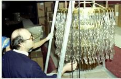
圖6 檔號：0076/0110102/017 案名：中正文化中心國劇院、音樂廳工程 來源機關：榮民工程股份有限公司 管有機關：國家發展委員會檔案管理局