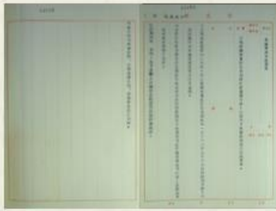
圖6 檔號：0058/531.3/0001-0002 案名：中基(基亞那)農技合作 來源機關：外交部 管有機關：檔案管理局