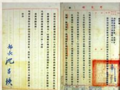
圖2 檔號：0049/11992-116036/00001 案名：赴非洲農林水利友好訪問團 來源機關：經濟部 管有機關：檔案管理局

50年起，由美國提供先鋒案經費，我國開始派遣農耕隊前往非洲協助農業建設(圖2)，主要工作是引進優良水稻品種到非洲國家，並進行各種技術合作與交流活動，譬如邀請非洲國家主管農業、鄉村衛生等事務之官員及技術人員來臺考察訪問(圖3)、開設農林漁業、鄉村衛生、手工藝與食品加工等訓練班，接受非洲各國學員來華參加講習等(註2)。