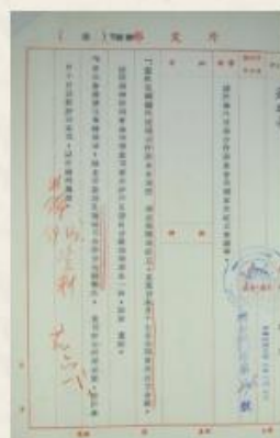
圖4 檔號：0054/131.3/0002-0005 案名：海外技術合作委員會 來源機關：外交部 管有機關：檔案管理局

50年11月，駐賴比瑞亞農耕隊前往非洲，成為我國派駐非洲的第一支農耕隊，接著是在次年3月抵達的駐利比亞農耕隊。兩支農耕隊皆成功在當地栽培稻作，後者更在撒哈拉沙漠中種植出水稻，一舉打響我國農耕技術的名聲，於是其他非洲國家紛紛前來邀請，希望我國派遣農耕隊傳授技術以增加糧產。51年「先鋒案執行小組」改組為「中非技術合作委員會」，以擴大執行該計畫；61年又將「中非技術合作委員會」與「外交部海外技術合作委員會」(圖4)合併為「海外技術合作委員會」(簡稱海外會)，專責農漁業技術團隊之派遣，協助友好開發中國家農業發展。