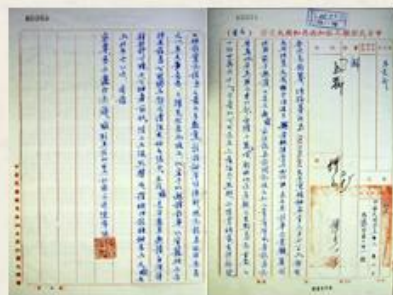
圖3 檔號：0055/212.22/0001 案名：塞席爾民主黨領袖孟肯訪華 來源機關：外交部 管有機關：檔案管理局

50年11月，駐賴比瑞亞農耕隊前往非洲，成為我國派駐非洲的第一支農耕隊，接著是在次年3月抵達的駐利比亞農耕隊。兩支農耕隊皆成功在當地栽培稻作，後者更在撒哈拉沙漠中種植出水稻，一舉打響我國農耕技術的名聲，於是其他非洲國家紛紛前來邀請，希望我國派遣農耕隊傳授技術以增加糧產。51年「先鋒案執行小組」改組為「中非技術合作委員會」，以擴大執行該計畫；61年又將「中非技術合作委員會」與「外交部海外技術合作委員會」(圖4)合併為「海外技術合作委員會」(簡稱海外會)，專責農漁業技術團隊之派遣，協助友好開發中國家農業發展。