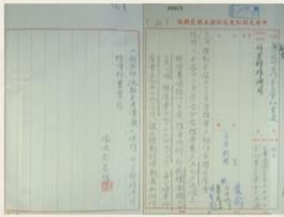
圖5 檔號：0063/231.33/0022-0026 案名：駐史瓦濟蘭農耕隊業務 來源機關：外交部 管有機關：檔案管理局