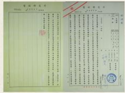
圖7 檔號：0071/205.22/0003 案名：趙匪紫陽訪問非洲

我國於60年退出聯合國，外交環境日漸艱困，美國也於62年停止援助先鋒案經費，農耕隊被迫逐漸退出非洲各國，僅在部分與我國有正式外交關係的國家保留農技團，繼續進行外交工作。