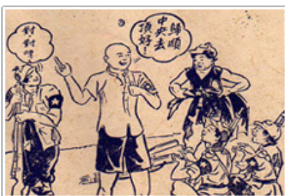
國軍宣傳單：被俘國軍策動共軍反正

35年1月，在重慶召開的政治協商會議，係對於政治情勢進行會商，此會議由中國國民黨、中國共產黨、民主同盟、青年黨及社會賢達等五方面代表，以雙十會談協議結果為基礎，並分政府組織、施政綱領及國民大會暨軍事等議題，完成各項原則性協議（檔案影像3-1~3-4）。惟共軍還是破壞協議，導致內戰爆發，和平鐘聲至此被槍砲聲響全面掩蓋。