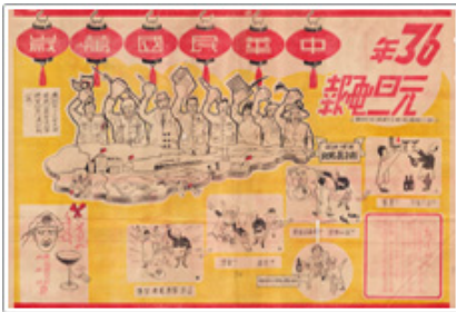
民國36年《力行週刊》元旦特刊

打開中華民國建國史，初期戰火連連，就在對日抗戰勝利，舉國欣喜和平降臨之際，隨後卻爆發國共內戰，期間宣傳戰不休，就讓我們從檔案看當年的宣傳單，體會文攻的激烈。