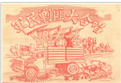
國防部所製發的「軍民剿匪大合唱」歌曲

由於共軍在雙十會談後，並未放棄武力攻擊，致使國共衝突越演越烈，戰爭一觸即發，在國內外呼籲國共合作以維持國內和平下，政府再度與共軍進行停戰談判。35年1月首先展開停戰協商，由張群（政府代表）、周恩來（中共代表）及馬歇爾（美國代表）組成三人小組，在重慶召開三人會議，達成初步停戰協議，然共軍對停戰協議卻未完全遵守，仍趁機在各地發動戰事，烽煙四起而和平破局，致使三人會議未達成結果（檔案影像2-1~2-5）。