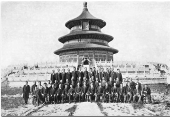
憲法起草委員會在天壇的合影