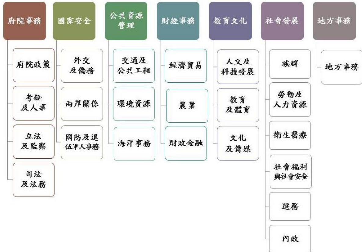
圖 1 國家檔案徵集架構圖

國家檔案徵集對象涵蓋政府機關及私人或團體，政府機關檔案為國家檔案徵集主要來源，依政府重要施政內涵及政務權責，提列國家安全等 7 項徵集方向。復依 7 項徵集方向及政府組織及業務分工架構，區分府院政策等 23 類別（圖 1）。另，依政府組織型態及核心職能，明定各徵集類別檔案來源機關（詳附件 2），以完整建構國家檔案內涵。