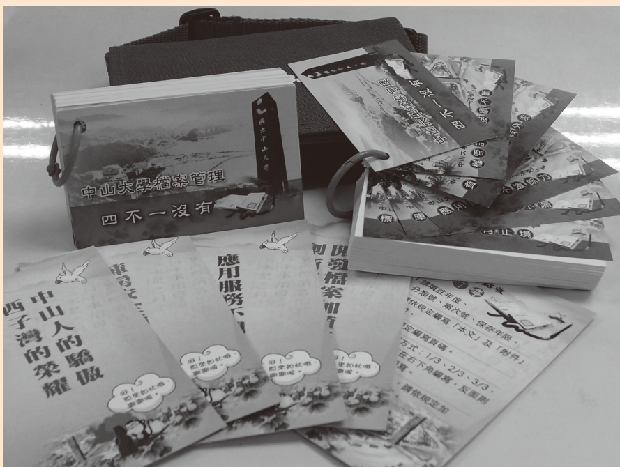
圖19 含有本校檔案應用服務活動成果之隨意卡

檔案法自91年正式施行，為我國檔案管理開啓新的里程碑，在行政院研考會檔案管理局積極推動下，於同年設置「機關檔案管理金檔獎」及「績優檔案管理人員金質獎」，並在92年辦理第1屆評獎活動，鼓勵各機關積極配合檔案管理新制的落實，藉此表彰著有卓越績效之機關，以及長期默默奉獻的檔