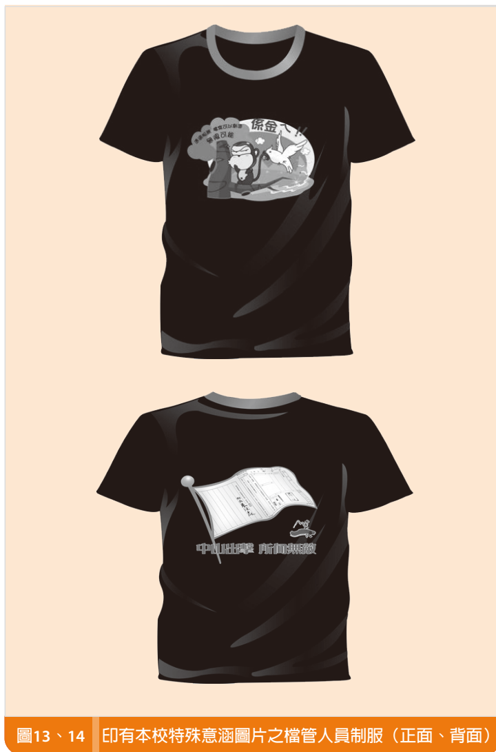
圖13、14 印有本校特殊意涵圖片之檔管人員制服（正面、背面）