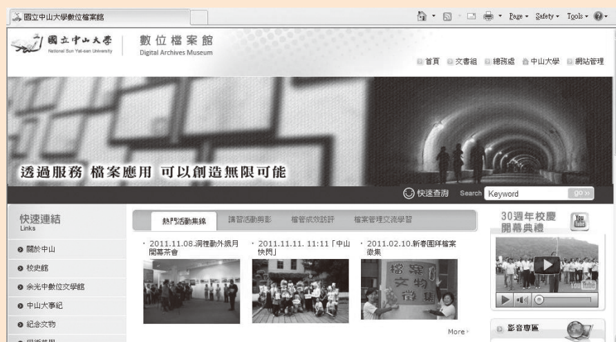
圖12 於本校網頁建置「數位檔案館」，呈現本校檔案應用成果，並提供檔案應用服務相關資訊