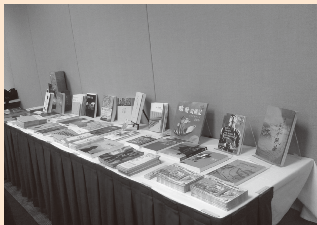
圖11 本校編輯出版之檔案研究專書——「檔案文物中的西子灣風華」（後排右一）參加第21屆臺北國際書展及第1屆國立大學出版社聯展