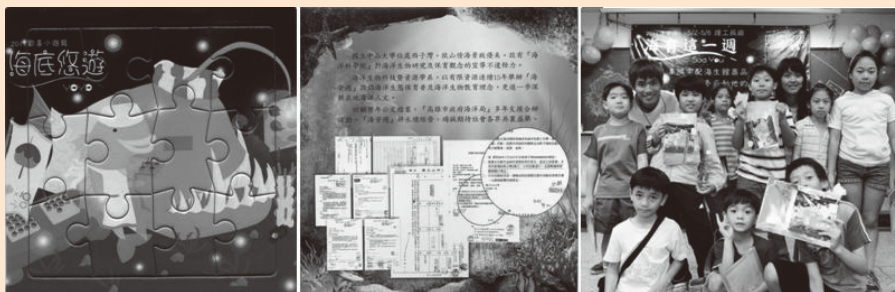
圖9 編印含有海洋資源學系歷年辦理「兒童海洋生態保育營」代表性檔案與海洋生物圖片之拼圖，贈送參與活動的小朋友DIY