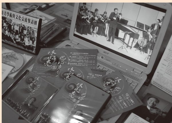
圖6 巴洛克獨奏家交響樂團歷年節目海報、節目單與演出CD