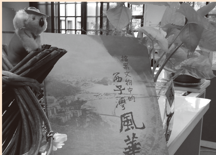
圖10 本校編輯出版之檔案研究專書—「檔案文物中的西子灣風華」

為提升政府知識管理效能，本校檔案研究專書—「檔案文物中的西子灣風華」出版後，於102年第21屆臺北國際書展及第1屆國立大學出版社聯展中參加展覽，讓社會大眾有機會認識西子灣與本校的歷史發展（如圖11）。