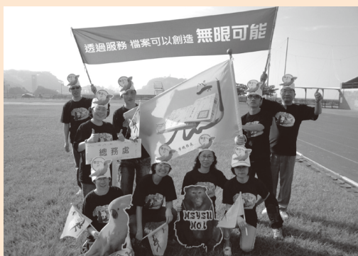
圖17 100年全校運動會時，總務處文書組同仁手持印有本校代表性檔案印製而成之大、小旗幟進場，檔案影像空中飛舞