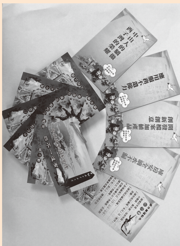
圖20 本校小書包，可裝置書籤及隨意卡

本校除至不同屬性機關學校標竿學習之外，也接待國內及國外檔管單位參訪，計有國立海洋生物博物館、空軍軍官學校、陸軍第八軍團、高雄市三民地政事務所、行政院環境保護署環境保護人員訓練所、彰化縣議會、中國上海市檔案館、上海同濟大學等8個機關，蒞校交流參訪，交換推廣檔案應用經