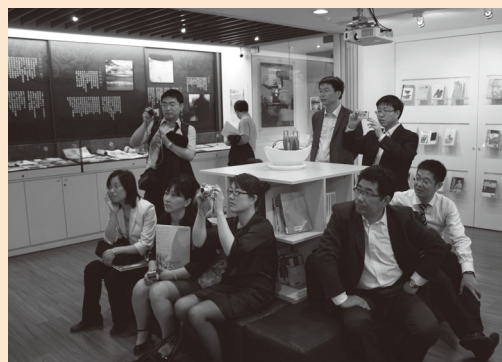
圖22 中國上海市檔案館蒞校參訪