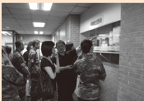
圖21 陸軍第八軍團蒞校參訪

五、以檔案文物為行銷的媒介，檔管人員扮演行銷尖兵的角色，建立交流的平臺，實施成效獲主管機關肯定，獲得新臺幣70萬元獎助，對未來機關檔案管理績效的提升，裨益良多。