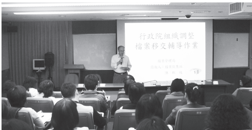
圖1——本局於99年11月24日辦理行政院組織調整檔案移交作業說明會