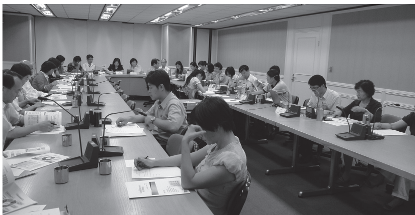
圖2——本局於100年9月6日辦理行政院組織調整檔案移交作業實地訪視內政部籌備小組