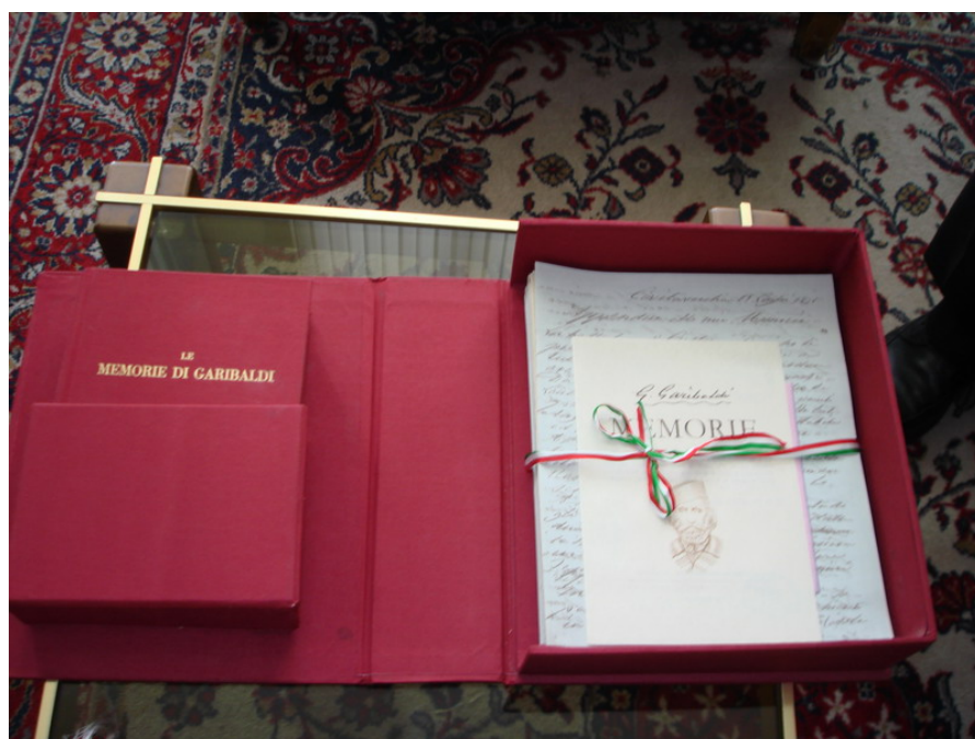
圖 4 中央國家檔案館所製作加里波地的家書複製品

義大利大憲章的複製品（相當於我國的憲法）以及義大利法西斯黨莫索里尼的女婿簽署要求獨裁者莫索里尼下台的文件複製品，也都引起義大利民眾很大的迴響。