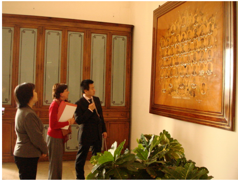
圖 3 義大利各政治家族發展演變圖