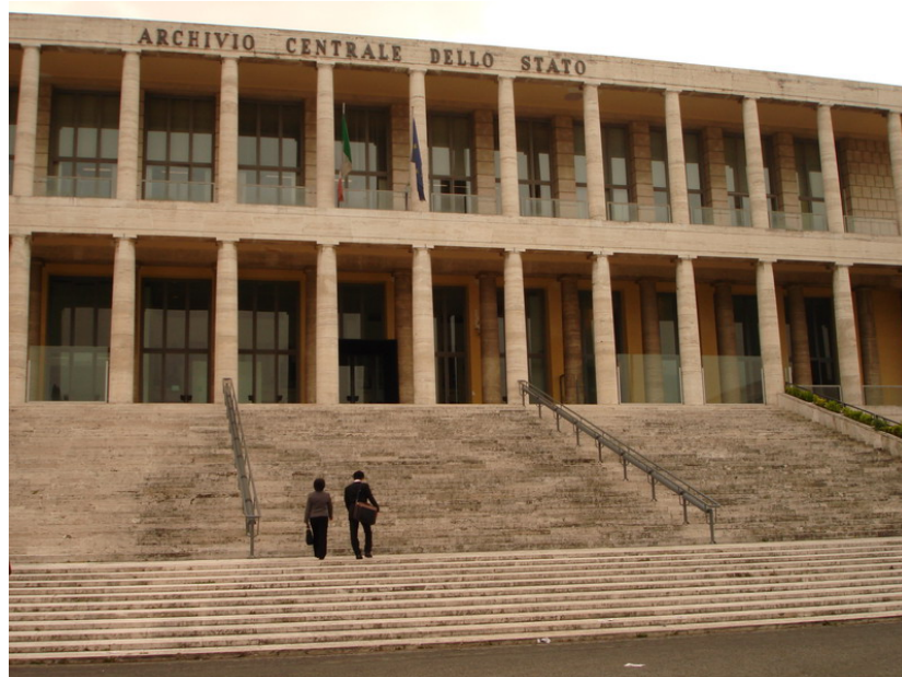
圖 1 中央國家檔案館外觀