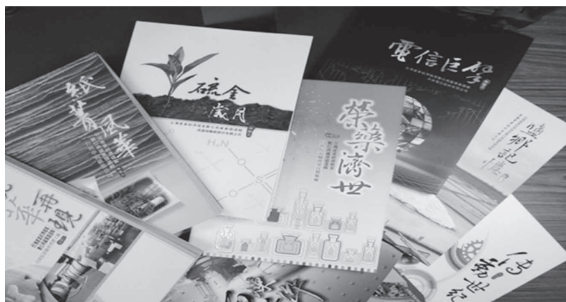
圖4——臺灣產業經濟檔案數位典藏專題選輯

中興紙業等11家公營事業檔案委託研究報告、檔案專題選輯暨電子書（如圖4），將依出版品形式保存於本局及各地圖書館等處，並可至本局全球資訊網免費下載電子書。