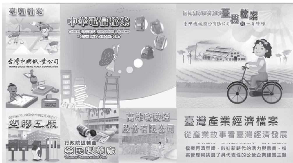
圖3——臺灣產業經濟檔案主題網頁

為了更便利社會大眾的使用，本局將業已完成的委外加值研究報告，依其完成時間陸續出版成書，並規劃為本局「臺灣產業經濟檔案數位典藏專題選輯」之系列叢書，除了主動發放國內各研究機構、大專院校及公立圖書館等閱覽單位外，亦於本局全球資訊網提供免費電子檔下載。