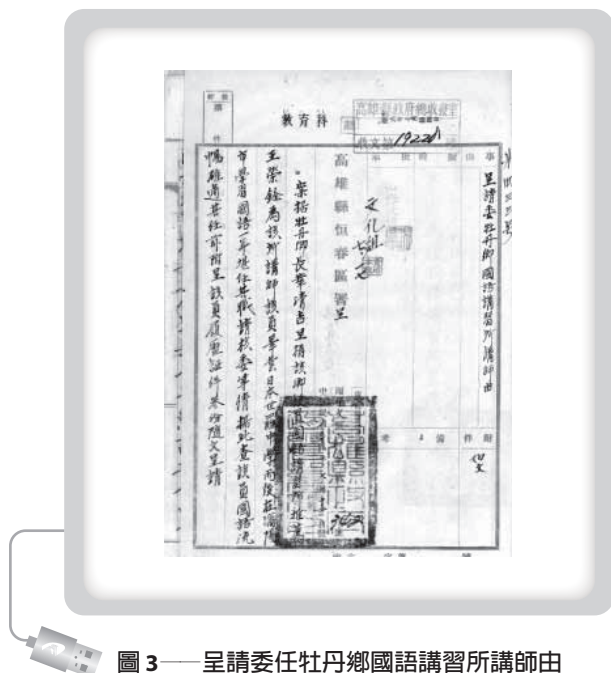
圖3——呈請委任牡丹鄉國語講習所講師由