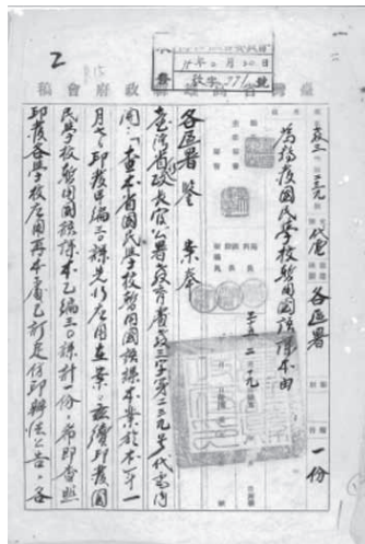
圖 2——轉發國民學校暫用國語課本事由