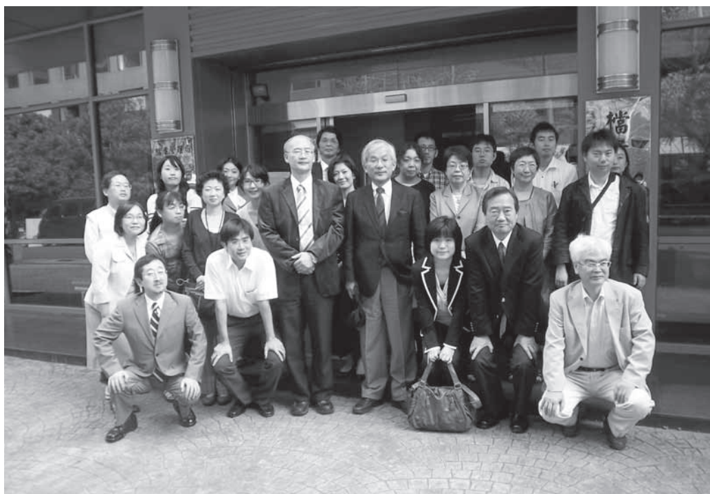
圖2——訪問團與本局代表於本局門口合影

本次參訪活動圓滿結束，學習院大學檔案學研究所師生熱烈求知之精神令人印象深刻，期待臺日雙方對於檔案管理相關議題，未來能有更多交流與合作機會（圖2）。