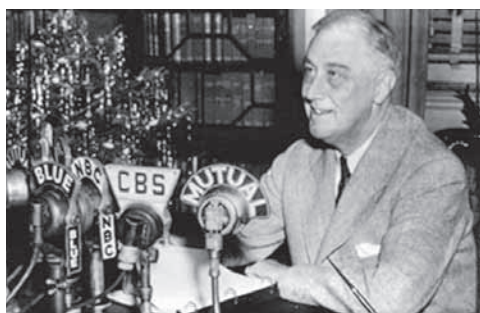
圖2——羅斯福總統在其圖書館進行爐邊談話 (1943年12月24日)