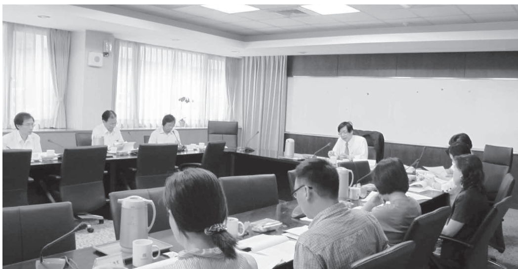
圖1——檔案審選委員會第5次會議開會討論情形

歷經5次檔案審選委員會議（圖1），各檔案審選委員依據行政院組織改造歷程，考量檔案之重要性、影響性、歷史性及趣味性等原則，擇選4大主題計50則重要事件之檔案，並撰擬主題及檔案內容解說文稿後，彙整出版檔案專題選輯。