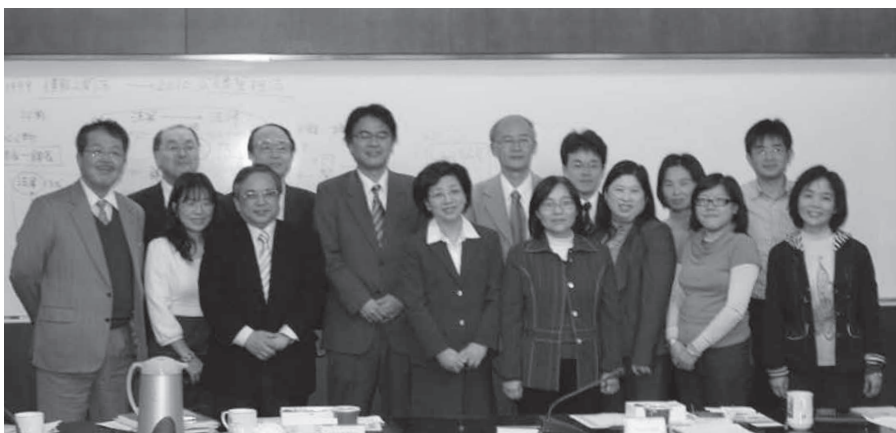
圖3——日本大阪大學法學研究院學者與本局同仁合影

本次參訪原訂於中午12時結束，因日方反應熱烈、雙方溝通愉快，一直到下午1時30分才結束，離去前，也同時參觀本局國家檔案閱覽中心及數位檔案博物館互動展示系統，對我國高度運用電子科技於檔案管理與應用，留下深刻印象（圖3）。