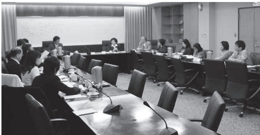
圖1——雙方進行意見交流

三阪教授表示日本雖有訂定檔案法（公文書法），但針對各機關的檔案管理、保管能掌握到什麼程度，仍是未知數。特別是因應資訊公開，