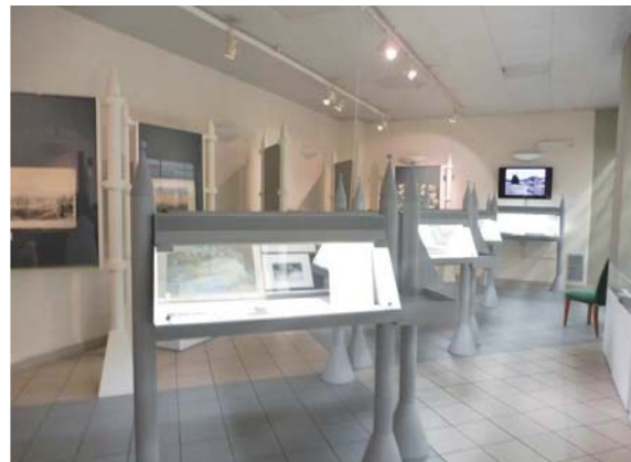
圖 17 歷史檔案館「杜林市河展」