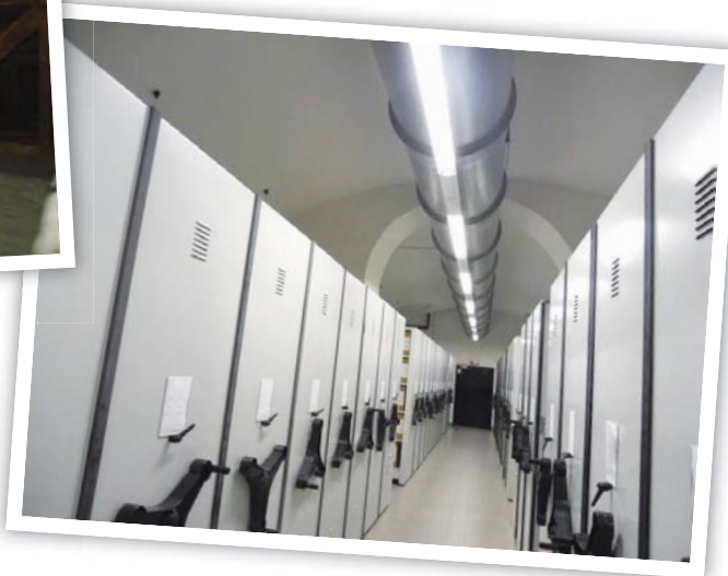
圖 10 90 年代修建位於地下室的新檔案庫房採密集式檔案架