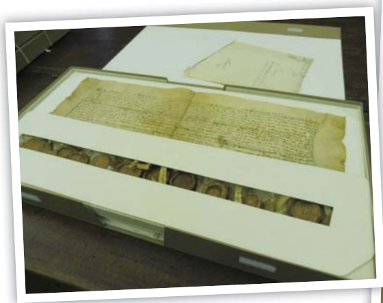
圖 4 薩沃伊王朝珍貴檔案

杜林國家檔案館原為薩沃伊王朝的皇室檔案館及圖書館，主要的館藏涵蓋義大利皮埃蒙特地區、義大利與歐洲間，跨越 1,300 年間之檔案，包括薩沃伊王朝原典藏教皇保留特權和 10 世紀的王國權利證明等珍貴文件，從典藏政治性的國家檔案，逐漸變成蒐集所有政府部門的檔案。館藏主要是按政府組織及職能相關的類別、主題整理分類，以提高內部管理效率和提供國際政治外交事務推動參考。此批文獻遺產，過去曾經為政府機關列為機密文件，當對其執行業務無參考價值後，會定期將檔案移給檔案館保存，現在這些檔