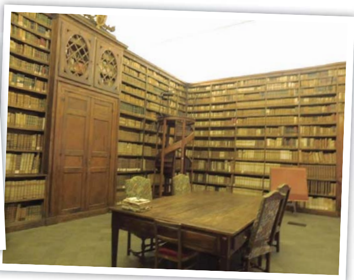
圖 5 薩沃伊王朝圖書館