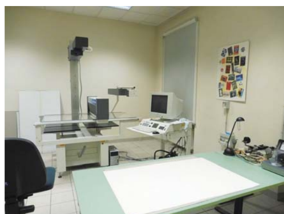
圖 15 杜林歷史檔案館複製儲存室