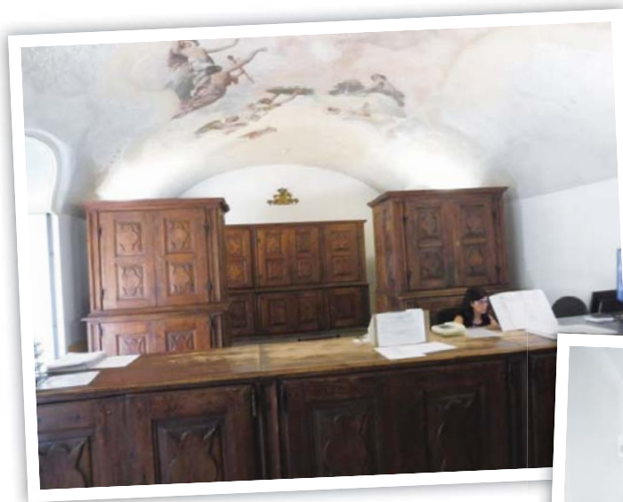
圖 7 杜林國家檔案館閱覽服務櫃檯