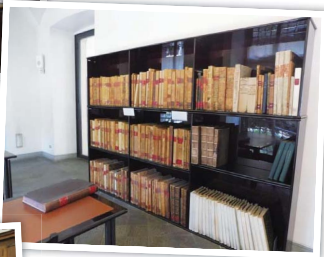
圖 8 館藏目錄因年代久遠亦成為國家檔案的一部分