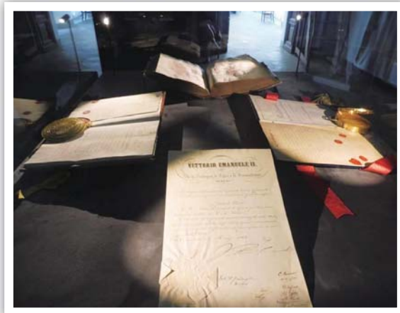
圖 6 薩沃伊歷史博物館珍貴檔案

杜林國家檔案館 1826 年成立檔案學與文獻學學院（Scuola di Archivistica Paleografia e Diplomatica），旨在訓練人員編排整理檔案、判讀及研究館內典藏檔案內容，目前全義大利另有 17 所檔案學院，