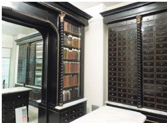
圖 16 順勢療法藥局