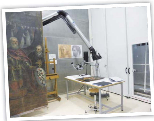
圖 1 文物檢測及修復