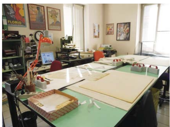
圖 14 杜林歷史檔案館紙質修復室