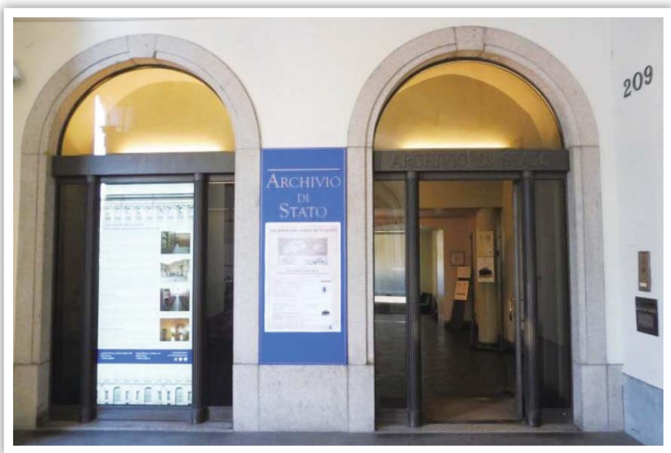
圖 3 杜林國家檔案館大門

義大利國家檔案局（Direzione Generale Archivi，簡稱 DGA）位於羅馬，其主要職責為監督義大利各時期所成立之國家檔案館，並管理寄存於各國家檔案館內之檔案文件，同時透過審選政府機構及非政府機關之檔案，徵集各地區最高行政機關之檔案為國家檔案。義大利各省首府設有國家檔案館（Archivi di Stato），保存義大利統一前的中央及地方檔案，及統一後之地方檔案，並設 8 個管理辦公室，管理其他國家檔案館，管理辦公室位於：佛羅倫斯、米蘭、那不勒斯、羅馬、杜林、威尼斯、波隆那、熱那亞。另有國家檔案館分館，位於非首府城市。各國家檔案館具有自治權，以確保檔案之保存及公開使用，為了檔案典藏應用及教育目的，得與政府機關及研究機構直接簽訂協議（Archivio di Stato di Torino, 2018）。