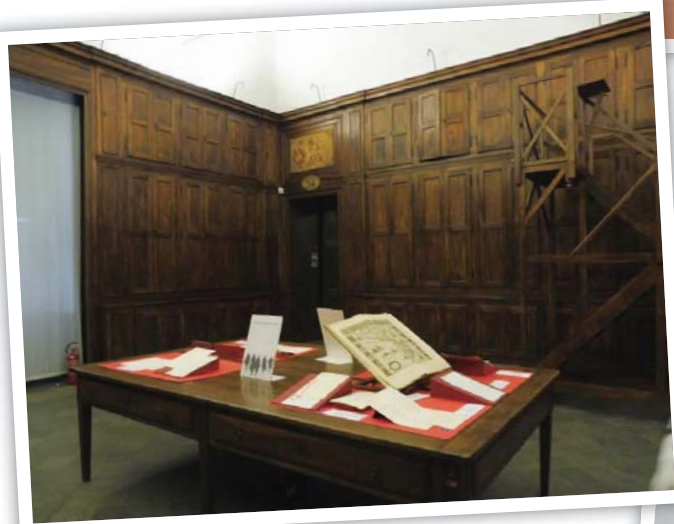
圖 9 薩沃伊王朝時期建置之檔案庫房及展示中的檔案