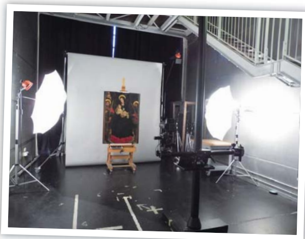
圖 2 文物攝影棚