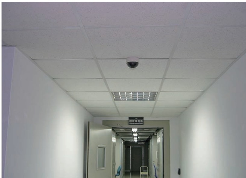
圖 86 屋內型紅外線彩色攝影鏡頭