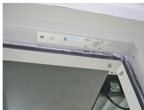
圖 83 庫房門禁陽極鎖