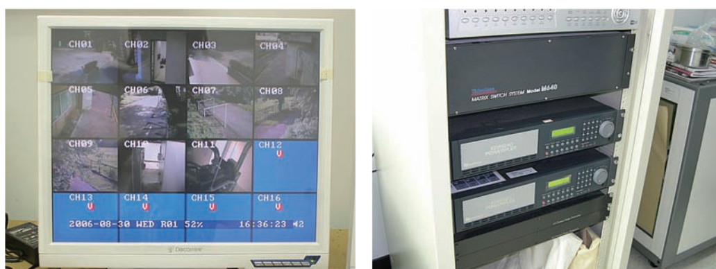
圖 85 錄影監視設備