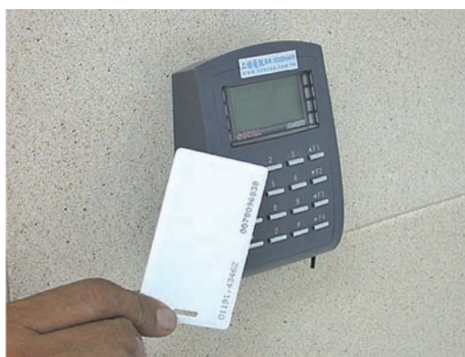
圖 82 感應式門禁刷卡機