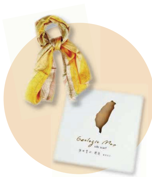
「與地質的。邂逅」真絲絲巾

檔 號：A303000000B/0043/602.7/7 案 名：地圖審查委員會 檔案產生日期：民國 42 年 檔案管有機關：國家發展委員會檔案管理局