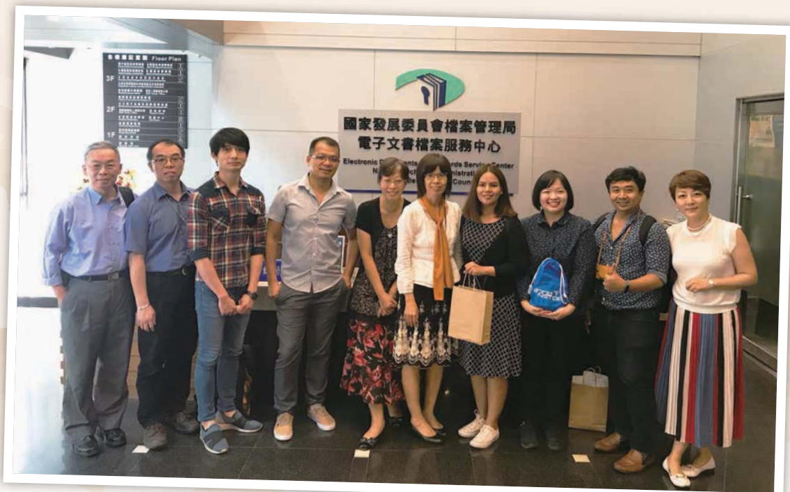
107.7.6 泰國科學技術知識服務圖書館人員至本局電子文書檔案服務中心參訪