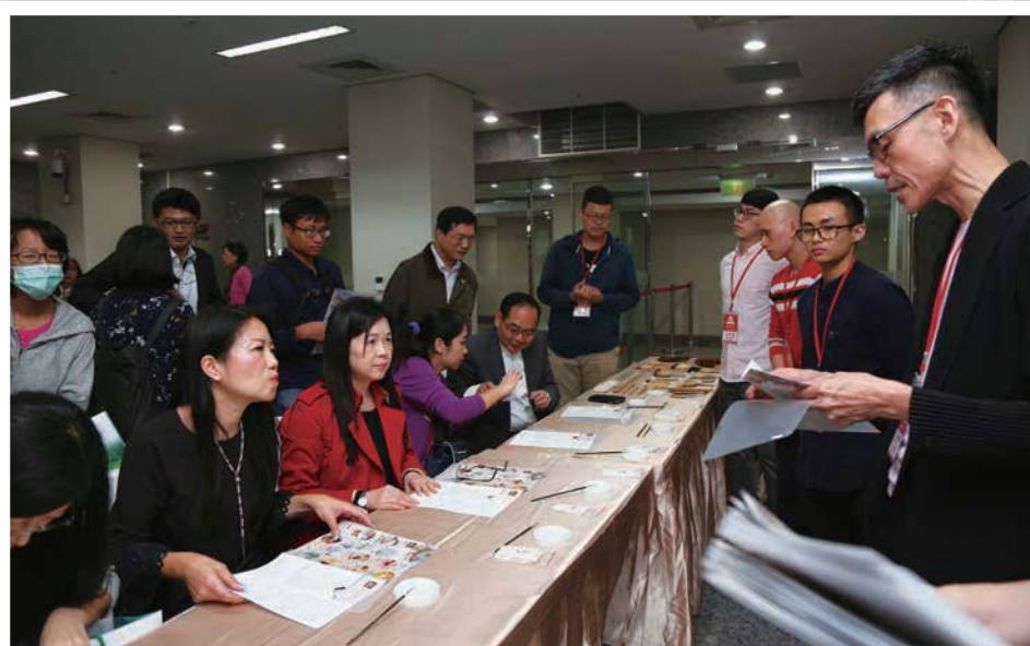
2018 首屆檔案月「檔案・有憶事」啟動儀式周邊活動