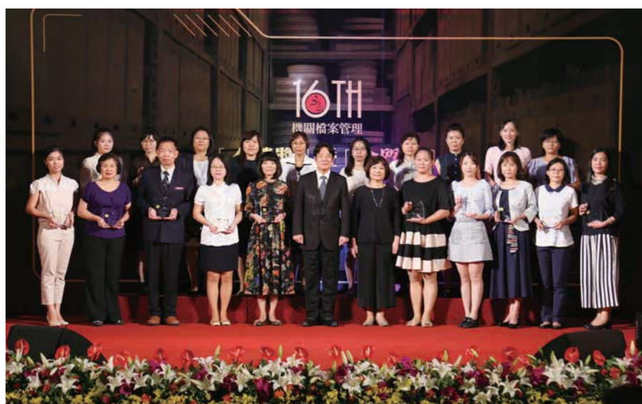
第 16 屆金質獎獲獎人員與行政院賴院長清德（前排左 6）及國家發展委員會陳主任委員美伶（前排右 6）合影