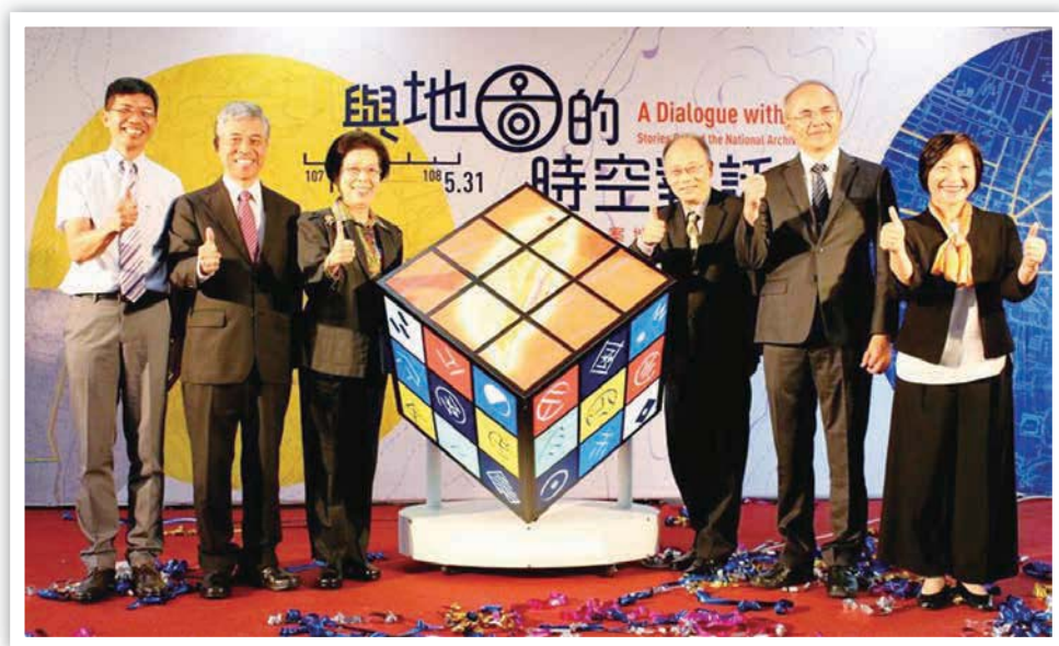
監察院張院長博雅（左 3）、國史館吳館長密察（右 3）、客家委員會范副主任委員佐銘（左 2）、國家發展委員會曾副主任委員旭正（右 2）、客家文化發展中心何主任金樑（左 1）與本局林局長秋燕（右 1）共同揭幕。

107 年 10 月 24 日在行政院新莊聯合辦公大樓綠廊舉辦開幕典禮，特別邀請監察院張院長博雅蒞臨致詞並與與會貴賓共同揭開序幕。本次展覽集結本局典藏的珍貴地圖檔案，並以「空間架構」及「比例尺」為策展基本概念，期望藉此展覽，讓民眾運用自身的空間經驗、記憶與地圖對話，此展覽持續展至 108 年 5 月 31 日，歡迎蒞臨參觀。