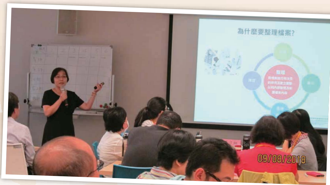
107.8.9-10 舉辦 107 年檔案立案、 銷毀與鑑定進階研習班（第 1 梯次）