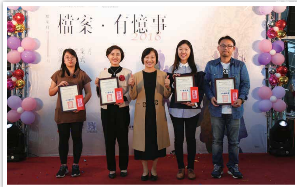
■ 本局林局長秋燕（前中）與研究論文類獲獎者合影

為鼓勵大眾一同加入檔案研究及創意設計的行列，本局特別舉辦 107 年推廣檔案研究應用獎勵活動，參獎作品計有研究論文類 10 篇及創意加值類 33 件，歷經初評、書面審查、複評，最後計有 6 篇研究論文與 9 件創意加值作品通過層層考驗、脫穎而出，並由本局林局長秋燕於 2018 首屆檔案月啟動儀式公開頒獎表揚。