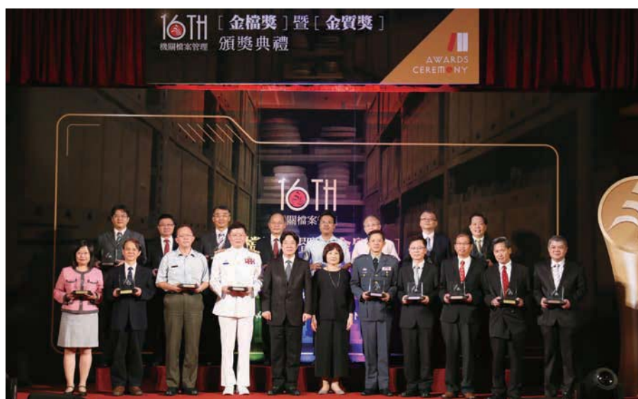
第 16 屆金檔獎獲獎機關與行政院賴院長清德（前排左 5）及國家發展委員會陳主任委員美伶（前排右 6）合影

第 16 屆金檔獎暨金質獎頒獎典禮於 107 年 9 月 12 日在國家圖書館國際會議廳舉辦，由行政院賴院長清德親臨致詞及頒獎，除了對獲獎機關與人員表達高度肯定與誠摯祝賀外，也期勉大家持續精益求精，讓各機關的檔案管理業務，更為周妥完善。