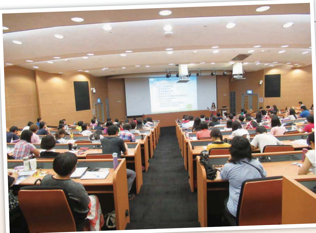
107.8.21-23 舉辦 107 年檔案管理研習班（北部場）