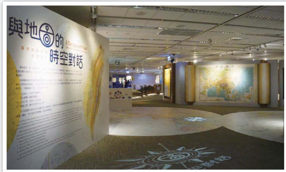
特展入口及地面全球地圖展示