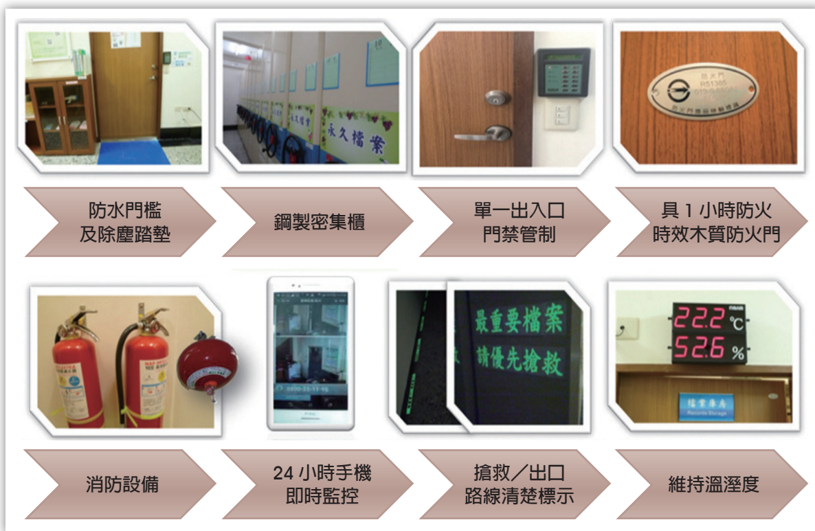
圖 7：庫房設施改善再升級