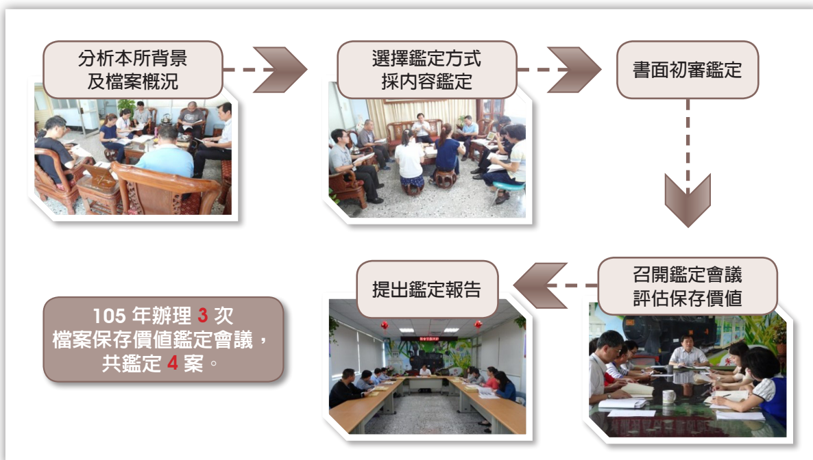
圖 8：召開檔案保存價值鑑定會議