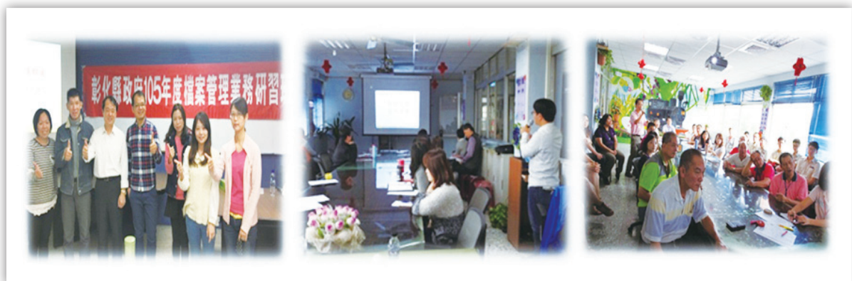
圖 12：參與各類教育訓練