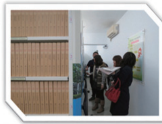
參訪：彰化縣北斗地政事務所 學習：庫房外設置黏塵踏墊等 3 項