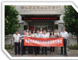
參訪：彰化縣鹿港地政事務所 學習：在地歷史等相關出版品 等 3 項