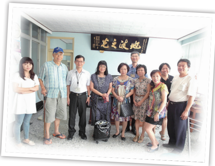
圖 21：跨國域的檔案應用