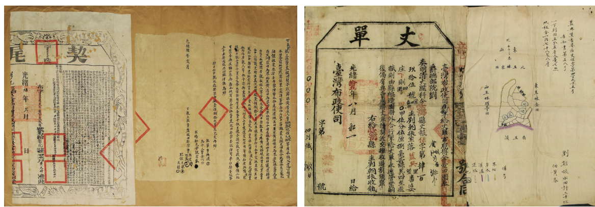
圖 16：土地契約附屬的官文書