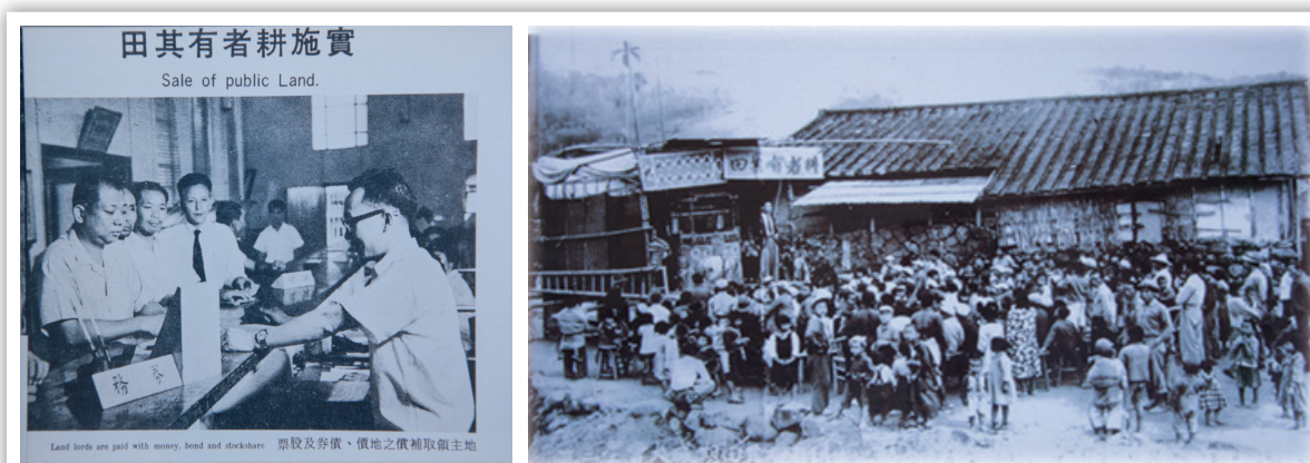
圖 19：早期地政改革舊照片

本所展覽品由同仁親自錄製語音說明，並附上 QR-Code 連結，民眾只要用手機掃描古文書旁的 QR-Code，就有專人導覽解說，除了讓展覽充滿科技感外，更進一步滿足視障者和老人家的需求，嘉惠鄉親。