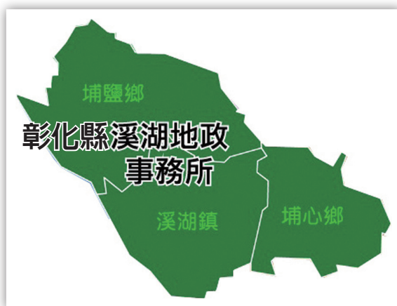
圖 1：彰化縣溪湖地政轄區

本所編制員額有 33 名，服務人口達 12 萬 3,178 人，轄區共有土地 10 萬 9,465 筆、建物 2 萬 960 棟，土地面積共 8,892 公頃。