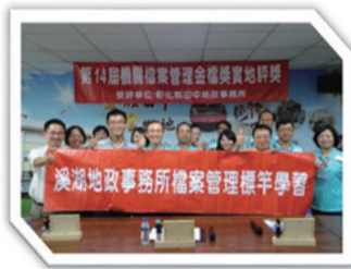
參訪：彰化縣田中地政事務所 學習：夜光指引標示等 2 項

為營造「從農業到工業」的穿越古今意象，檔案布置融入農村文化「稻草人與牛車」展示，並推動數位檔案應用，展出溪湖鎮屯墾以來，各種地契、圖書等 20 多件古文書資料，顯現地政