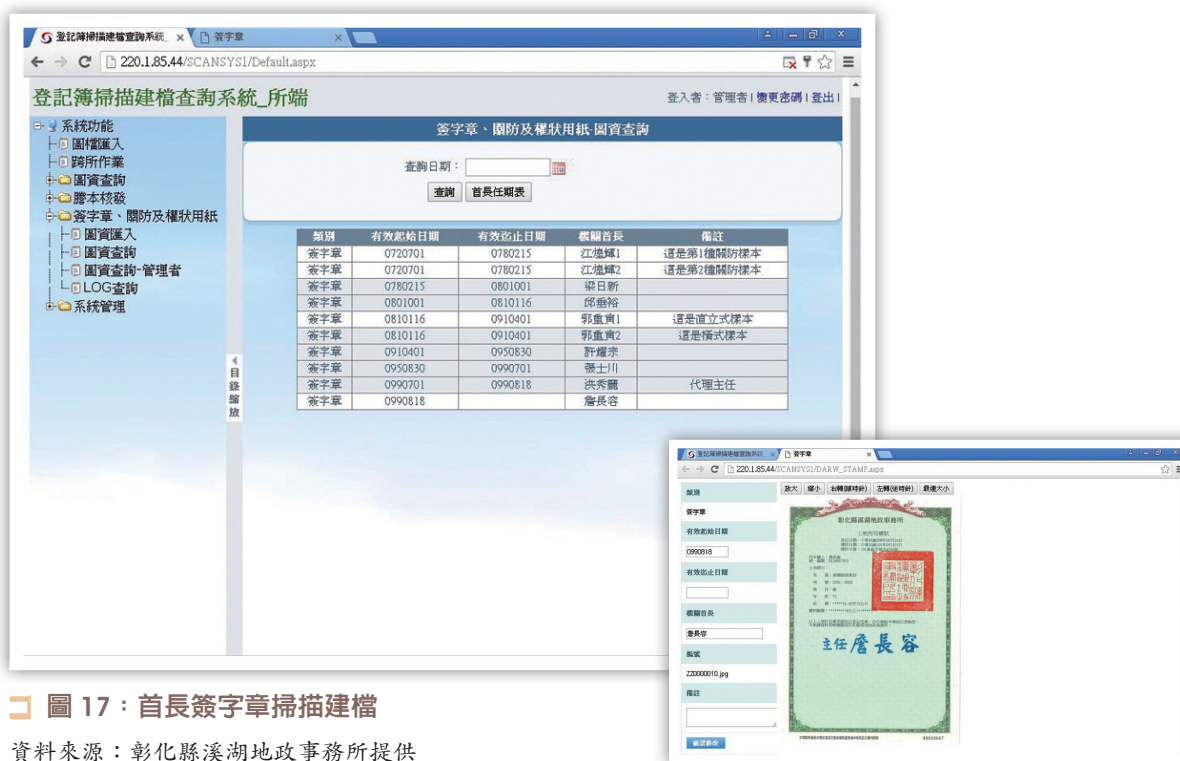
圖 17：首長簽字章掃描建檔