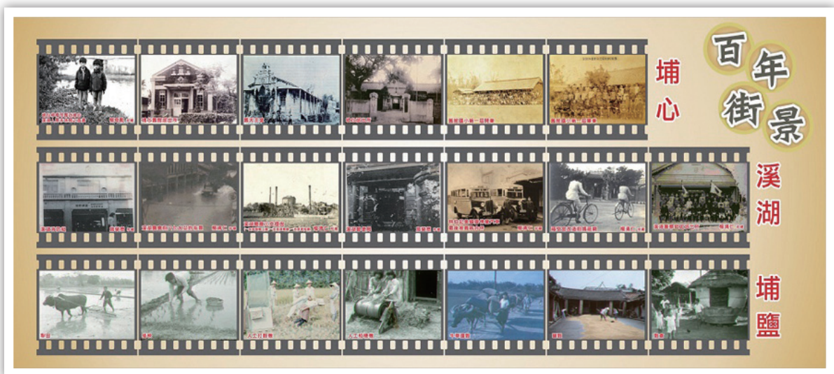
圖 14：百年街景，老照片懷舊特展