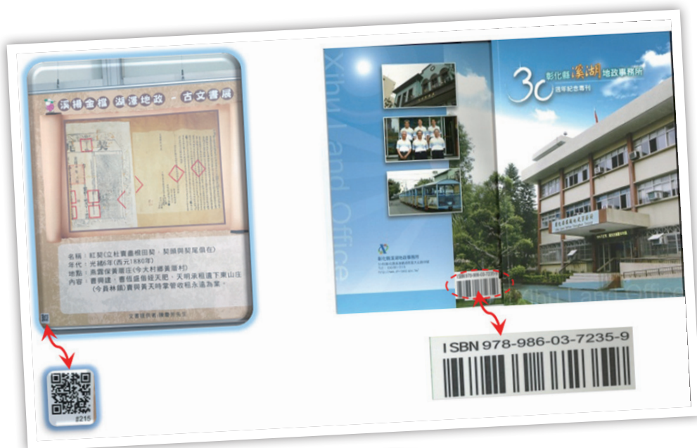
圖 20：QR-Code 語音連結及出版品取得 ISBN

一對設籍日本的母女，4 年來陸續查詢繼承財產所在位置，因地域受限未得其解，因此專程回臺向本所調閱繼承登記原案，並複製檔案公文（如圖 21）。透過本所提供的檔案應用服務，母女除了得以清楚全部家產所處位置以外，並意外發現尚有土地漏辦繼承，多年疑惑終能解除，2 人滿意離開，並郵寄感謝狀表達謝意。