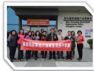
參訪：彰化縣溪湖戶政事務所 學習：檔案櫃製作標示年份之 壓克力牌等 4 項