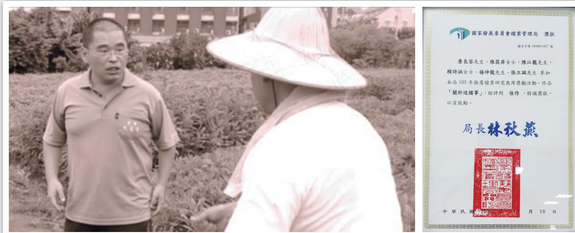
圖 18：檔案應用宣導微電影「關於這檔事」