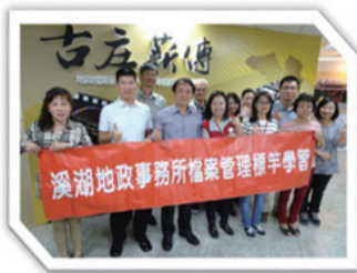
參訪：新北市新莊地政事務所 學習：文物展品可掃描 Qrcode 播放語音導覽等 2 項