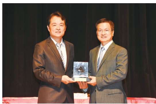
圖 22：本所榮獲第 15 屆金檔獎後，由作者親呈獎盃予縣長

本所也會把金檔獎的精神繼續傳承下去，讓更多前來標竿學習的參賽機關也能夠跟溪湖地政一樣獲得金檔獎最高的榮譽。