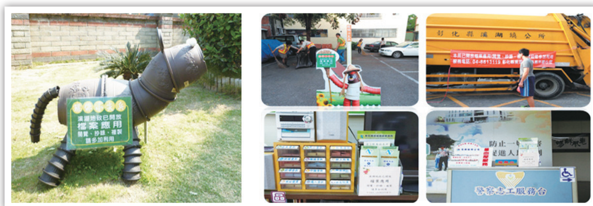
圖 9：回收盆器改造宣傳、跨區域行銷、跨機關宣導