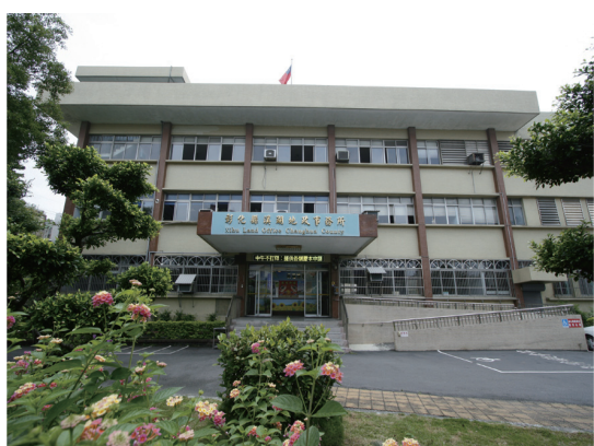
圖 2：彰化縣溪湖地政事務所外觀