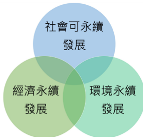
圖 1. 三支柱所形成的永續核心

永續發展是指持續發現既能滿足當代人的需求，又不損害後代人滿足其需求的發展。檔案展覽是檔案與觀眾間有效的溝通媒介，為表現出檔案的真實內容與故事，展場內透過大量的布置與真實的場景，使觀眾加深對檔案的印象，以了解內容資訊的意義。因此，每次的檔案展覽須經由策展人及設計團隊依當前的主題，打造出最能呈現資訊特性之展示展示空間。不同的檔案展覽在設計製作的階段，需要使用各種的資源，例如：展示櫃、圖文展示內容、照明、溫濕度控制等，甚至電源配置、營運使用的人力資源與運輸等。一次的展覽結束後需重新設計所有的內容與展場布置，再次投入大量資源與人力的同時也要處理